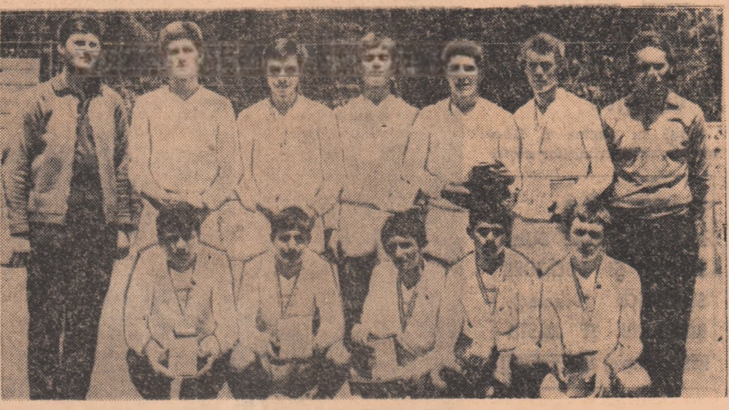
Campiona școlilor profesionale la volei, Chimia Copșa Mică, pe care v-o prezentăm în imaginea alăturată, a fost de departe cea mai bună formație

monstrat și cu alte prilejuri. Școlile profesionale sînt o sursă sigură de talente pentru echipele divizionare. Echipe ca C.F. Băicurești, Mina Petroseni, Metalurgica C. Turzii, Petrolul Iocromeni au în componența lor mulți jucători care, supuși unui antrenament corespunzător, pot constitui în câțiva ani pionii principali ai unor echipe din diviziile superioare.