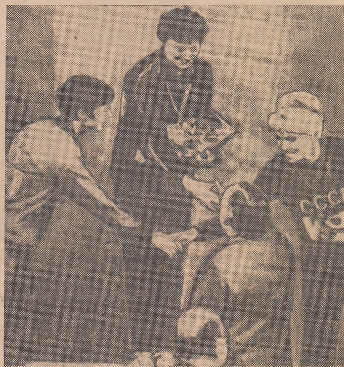
Festivitate de premiere la săritura în lungime femei. Noua campioană olimpică, Viorica Viscopoleanu, este feliicitată de marchizul de Exeter, președintele Federației internaționale de atletism

REPORTAJE ȘI COMENTARII, DE LA TRIMISUL NOSTRU SPECIAL LA A XIX-a OLIMPIADĂ