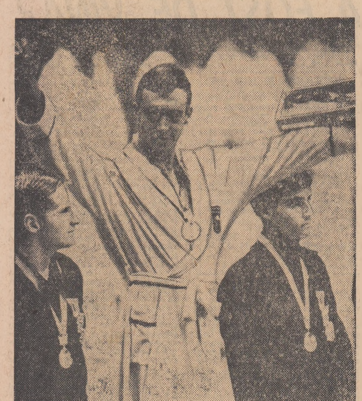
Mike Wenden (Australia), noul rege al sprintului, între amertăcanii Ken Walsh și Mark Spitz