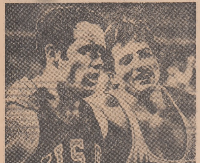
Bill Toomey (S.U.A.), cîștigător al medaliei de aur, și Kurt Bendlin (R.F.G.) după epuizanta lor luptă din cadrul decathlonului