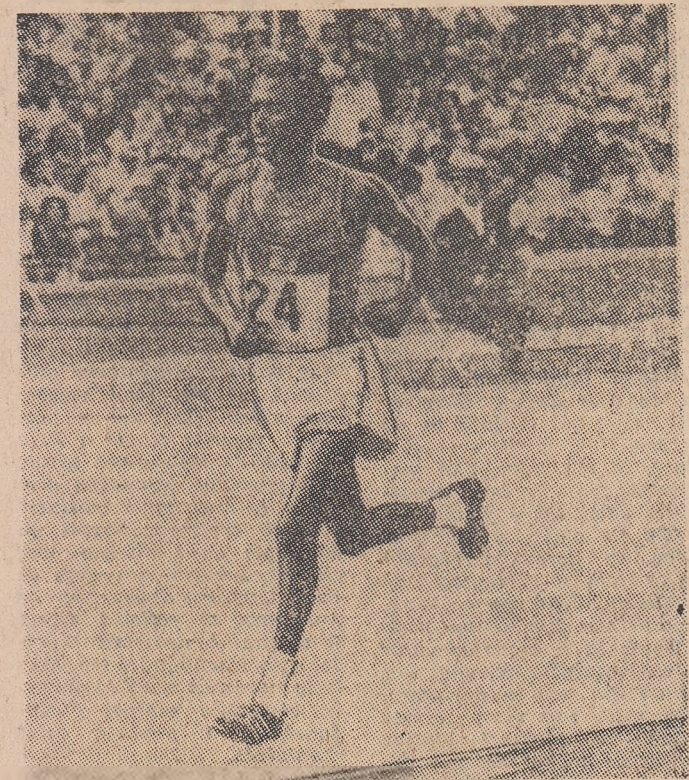
După Bikila Abebe, a fost rindul conaționalului său, Mamo Wolde, să încheie victorios maratonul olimpic. A treia victorie, deci, la maraton pentru alergătorii etiopieni