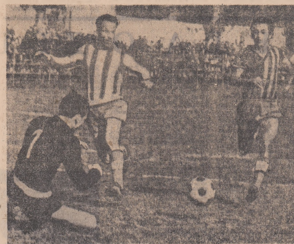
Un nou atac la poarta oaspeţilor. Golul va fi evitat. Fază din meciul Flacăra roşie Bucureşti — Celuloza Călărăşi