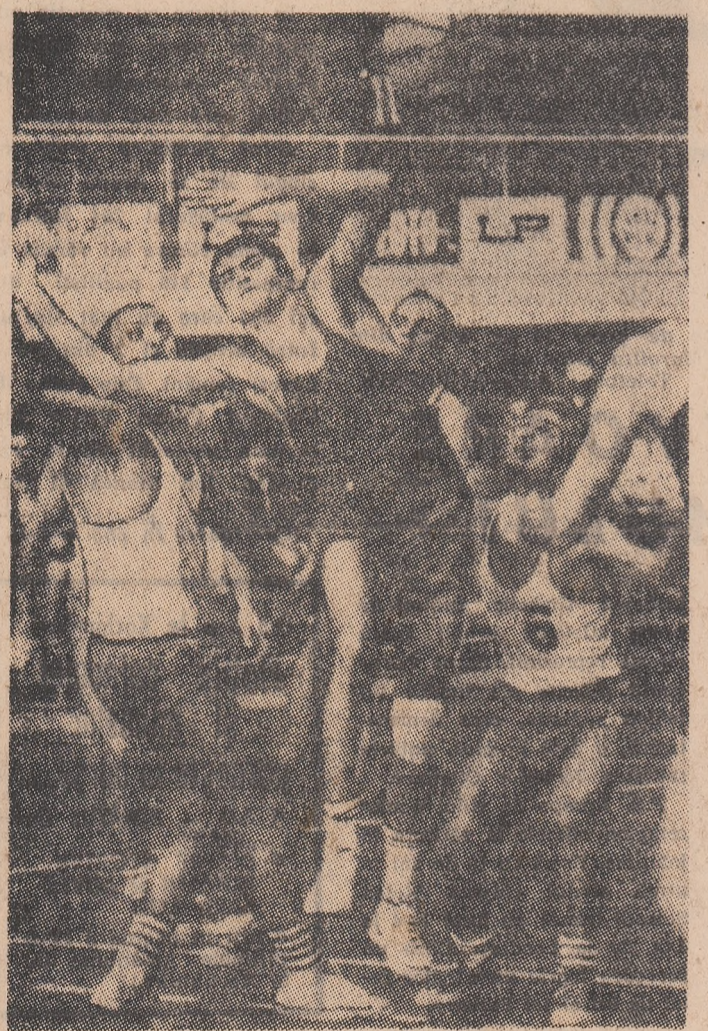
Mingea plutește încă în aer. Care dintre cei cinci jucători va intra în posesia ei? (Fază din meciul Steaua — I.C.H.F.)