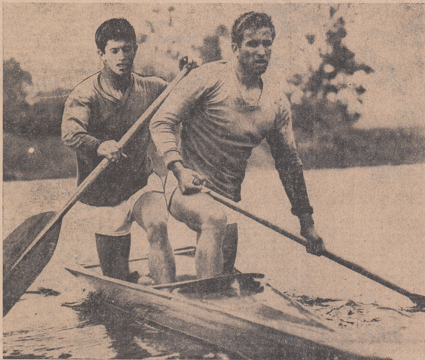
PREDECESORI LA ONORURILE OLIMPICE