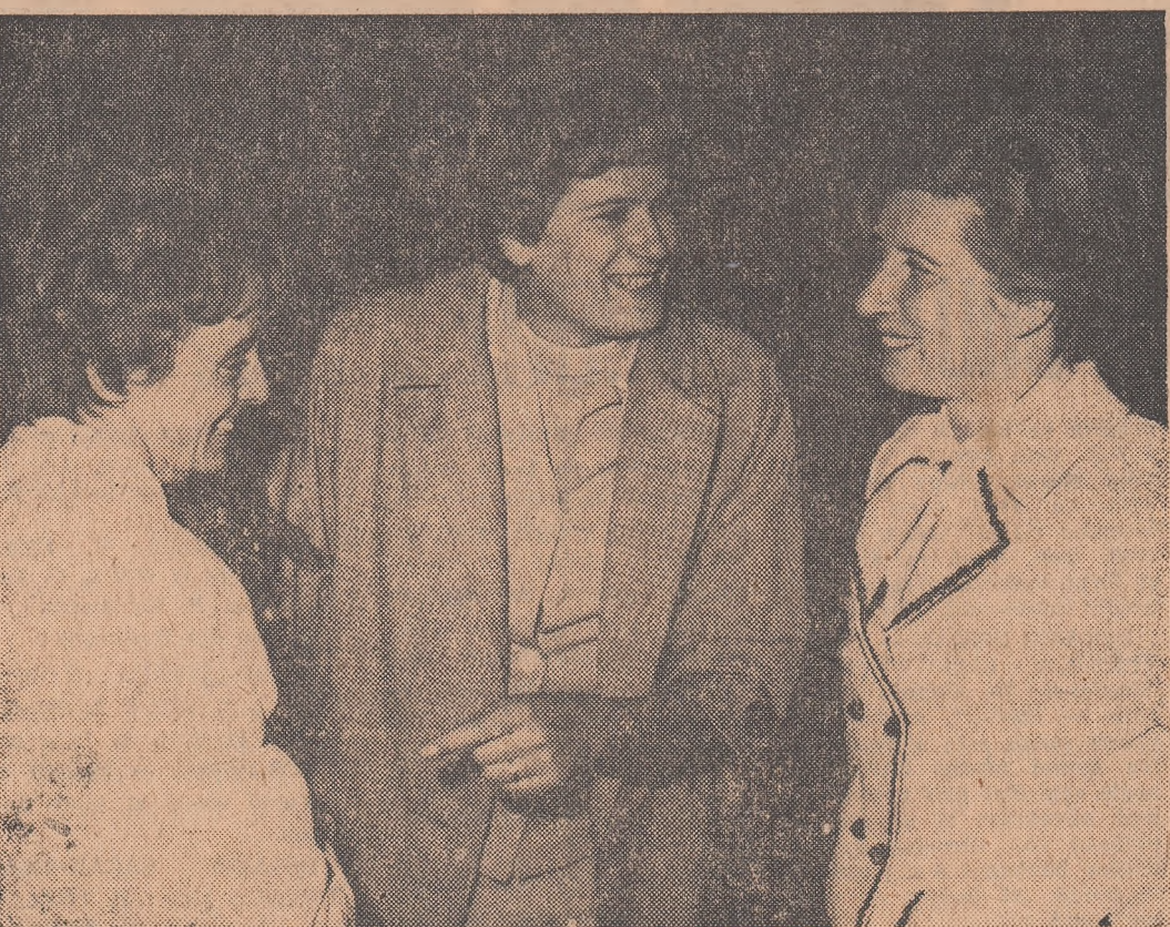
Un „trio” de aur: Viorica Viscopoleanu, Iolanda Balas (venită în întîmpinarea olimpicilor la aeroport) și Lia Manoliu.

— Bun sosit! — Bine v-am găsit! Ne-a răspuns comandantul aeronavei, TITI ENB. — Sintem pregătiți să notăm, pentru cititorii noștri, impresiile dv. din această călătorie peste Atlantic. — Ne-a făcut o deosebită plăcere să fim primiți dintre cei de-acasă care-i felicită pe o-