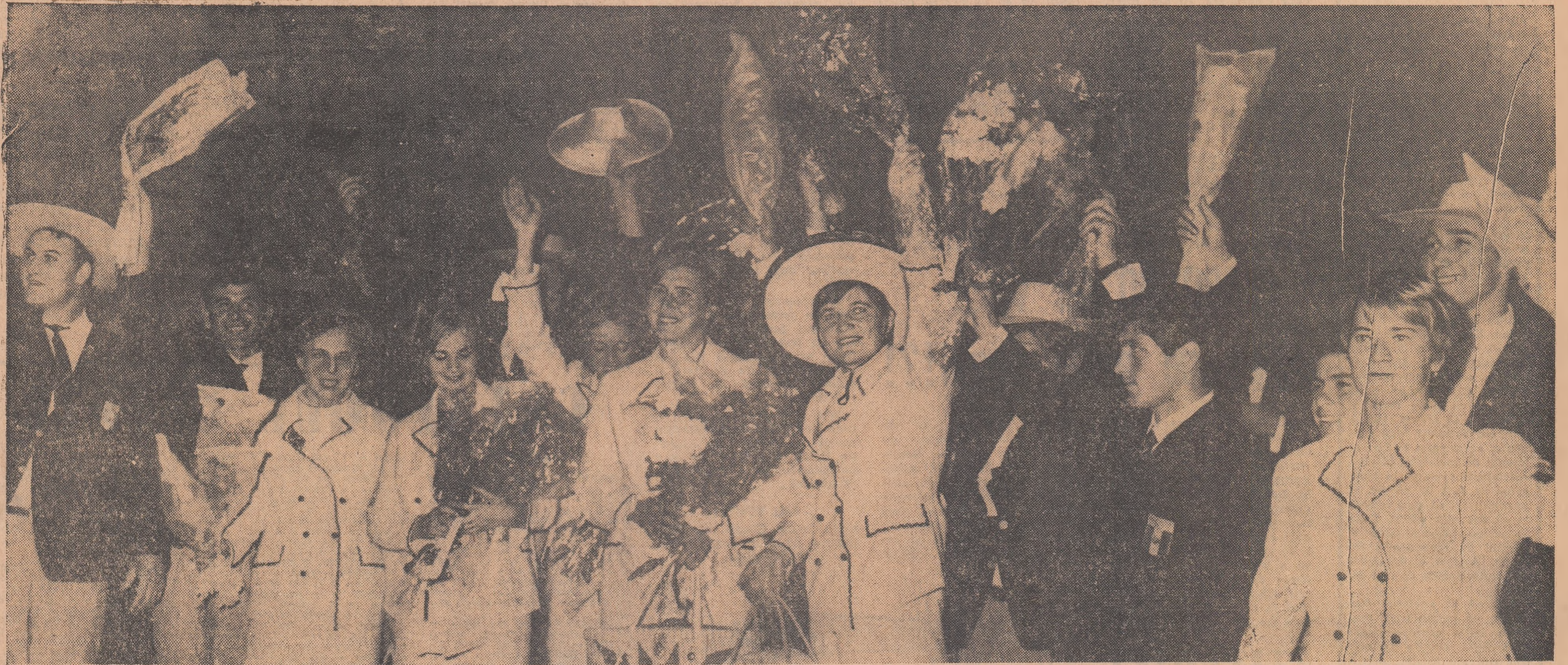
Olimpicii răspund entuziasmelor ovății ale nenumăraților admiratori care i-au întâmpinat ieri după amiază la sosirea pe aeroportul Băneasa. A fost o caldă manifestație adresată celor ce s-au străduit și au reușit să reprezinte cu cinste sportul românesc la Ciudad de Mexico.