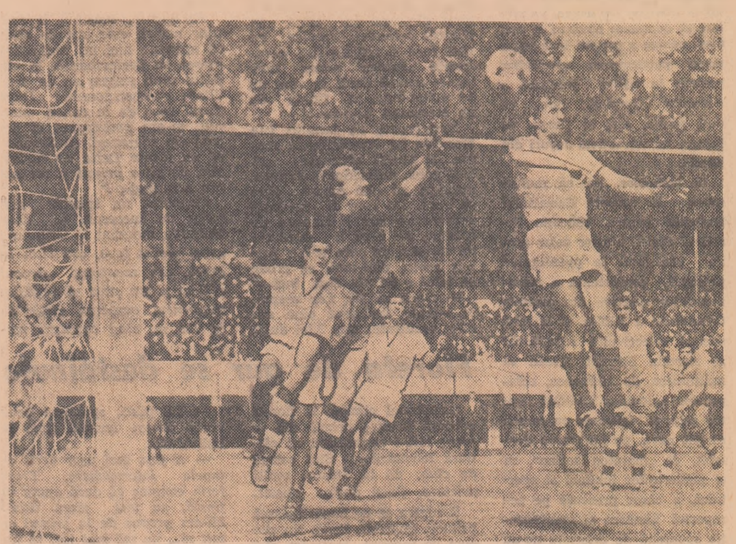
Uneori — din păcate, cam rar — divizia C cunoaște partide spectaculoase, cu faze de poartă de un real dinamism, cum demonstrează imaginea de mai sus, surprinsă de colaboratorul nostru I. Popescu la meciul Rapid Ploeni — Gloria C.F.R. Galați (5—0)

Revenind la situația materială a echipelor, trebuie să spunem că ea diferă de o asociație la alta. Sînt unele asociații cu posibilități materiale foarte reduse, care fac eforturi mari pentru ca echipele lor să supraviețuiască. Ar fi bine să se găsească modalitatea ajutorării acestor echipe de către foru-