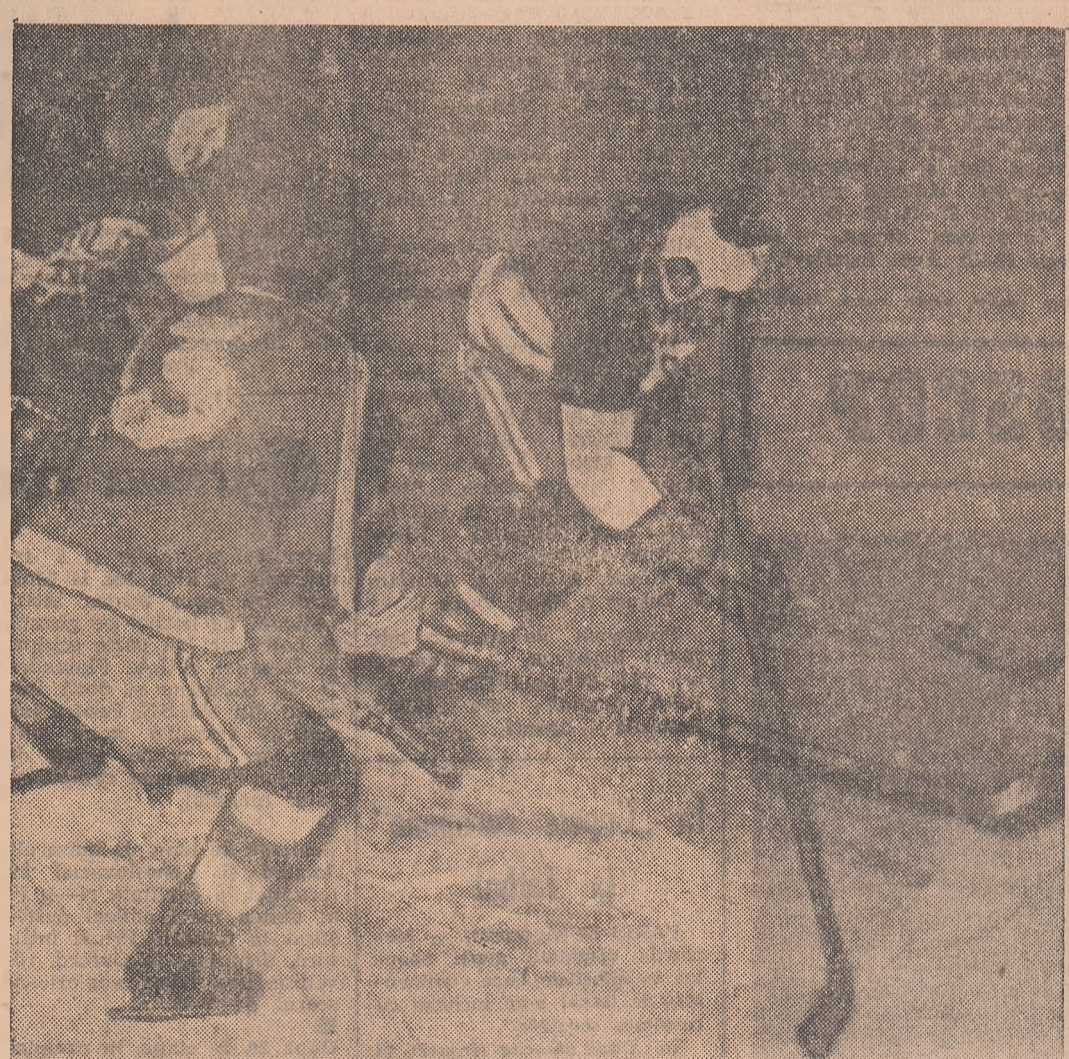
Aspect din meciul Dinamo-Petrol Gaze Geologie

Tot atît de neconvîngător a evoluat și Steaua. Se pare că laudele (pe deplin meritate atunci) adresate, în mod unanim, după meciul cu Dinamo au avut un efect invers asupra acestei echipe. În partidă cu Avintul M. Ciuc, hocheiștii de la Steaua au acționat rapid