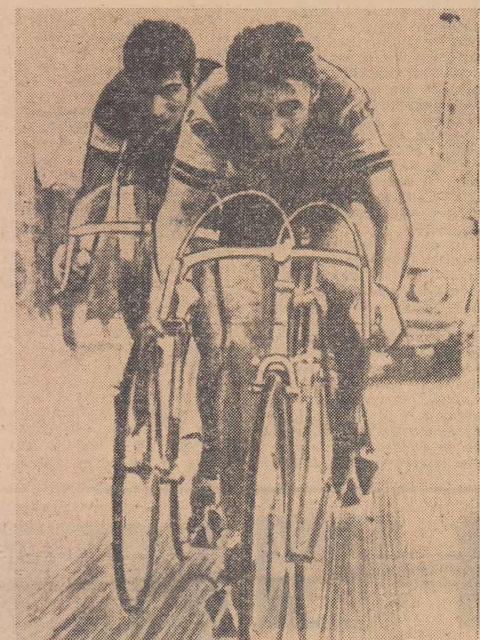
Marele as al ciclismului francez, Jacques Anquetil, continuă să culegă trofee, în ciuda anilor, a căror cifră se apropie de 35... Îl vedem aici pe neobositul Jacques (în prim plan), însoțit de coechipierul său, nu mai puțin celebrul Felice Gimondi, în timpul recentului „Trofeu Barracchi”, câștigat de cei doi la apreciablea distanță față de perechea Ole Ritter — Van Springel, clasată pe locul secund

Potrivit unui clasament al ziarului „Les Sports” — Bruxelles, cel mai bun ciclist profesionist al anului 1968 este belgianul Eddy Merckx, câștigător al turului Italiei și victorios în alte 24 de curse internaționale. În urma lui sint clasați în ordine Van Springel (Belgia), Bitossi (Italia), Janssen (Olanda), Gimondi (Italia).