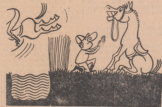
Rugăciunea jockeyului (Din „START”-BRATISLAVA)

Mare surpriză la recenta ediție a Olimpiadei de șah de la Lugano. Componenții echipei de șah a Greciei au apărut la mesele de joc îmbrăcați în uniforme olimpice: pantaloni gri deschis și sacouri bleu, pe care era scris: „Grecia”. Caz fără precedent în analele competiției. Acțiunea face parte din campania pe care o întreprinde federația elenă de specialitate în vederea punerii candidaturii sale de a organiza ediția a XX-a a Olimpiadei de șah. Ediția a XIX-a, după cum se știe, va fi găzduită de orașul Stegen (R. F. a Germaniei).