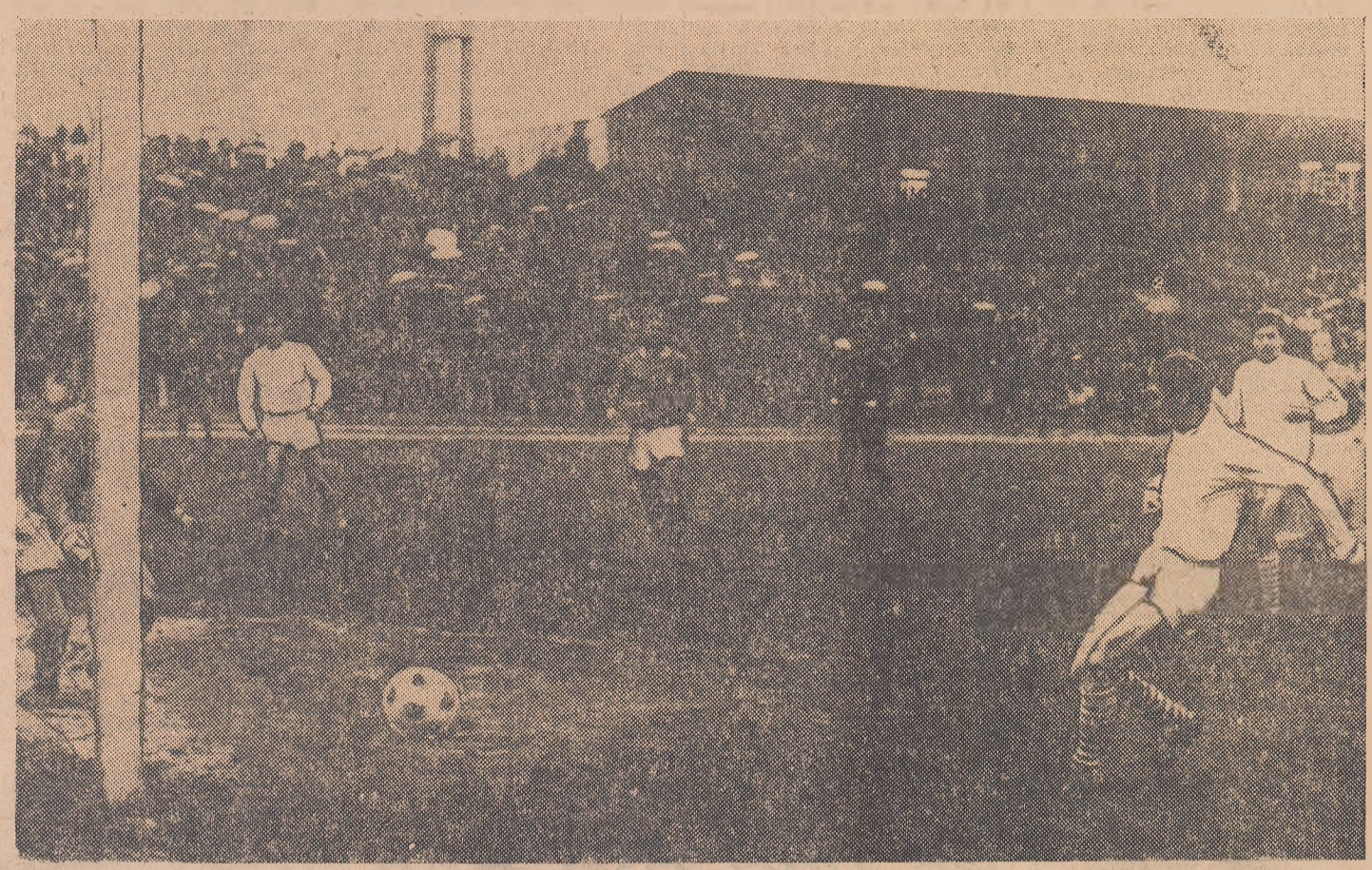
Jercan înscrie cel de al treilea gol, care, din păcate, va fi și ultimul.

Doi echipe de fotbal românești, Dinamo București și F.C. Argeș, au susținut ieri meciuri internaționale în cadrul competițiilor europene „Cupa Cupelor” și, respectiv, „Cupa orașelor țiguri”. Fotbaliștii de la Dinamo ne-au oferit satisfacția unui joc bun, în compania unui adversar mult mai redutabil decât îl anunțau antecedentele, dar din păcate nu și un rezultat pe aceeași măsură. Încurajator pentru meciul retur de la Birmingham. La Pitești, așteptam să se repete „minunea” de anul trecut, din meciul cu F.C. Toulouse. Ea nu s-a produs, deși, la un moment dat, în repriza a II-a, părea verosimilă, astfel că F.C. Argeș a trebuit să părăsească competiția care, în 1967, o consacrase. (Citiți în pag. a 3-a cronicile meciurilor.)