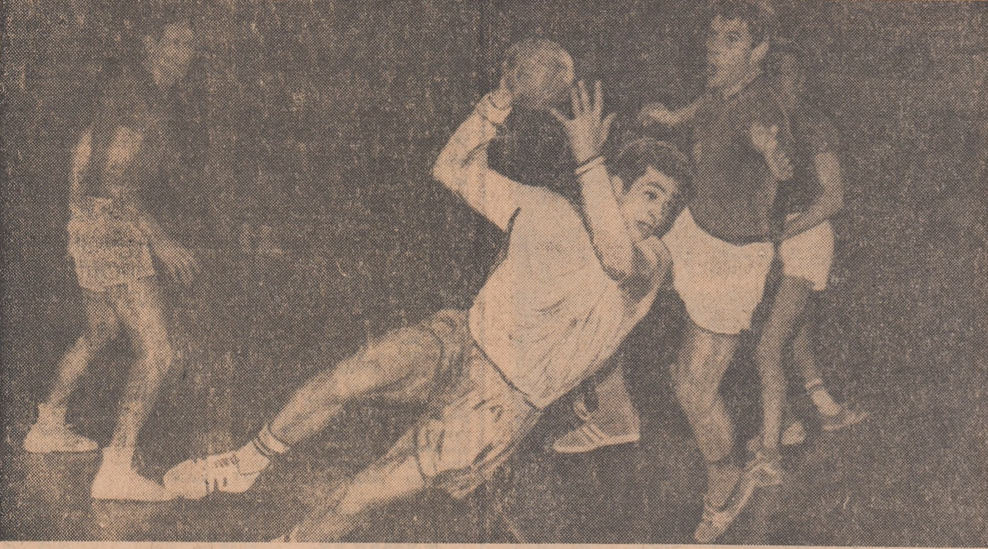
Samungi a scăpat din nou de sub „supravegherea” jucătorilor maghiari și va marca

R.S.S. GRUZINĂ — SPANIA 22-21 (13-11). Arbitru: Vl. Cojocaru (România). Au înscris: Ekseloidze 2, Phakadze 2, Gazdellani 5, Terivadze 7, Nedabalo 5, Hincakavil de la învingători și Moreta 3, Arme 6, Morale 9, Medina, Sagara, De Miguel de la învinși. IUGOSLAVIA — ROMÂNIA 22-16 (11-8). Arbitru: H. Bercinger (Evelia). Au jucat: IUGOSLAVIA: Kostic (Mervar) — Pokrajac 1, Miskovic 2, Zagmestar 9, Lavric 2, Karalic 1, Dragicevic 5, Pezic 2, Popovic, Lazarevic, Martincevic; ROMÂNIA: