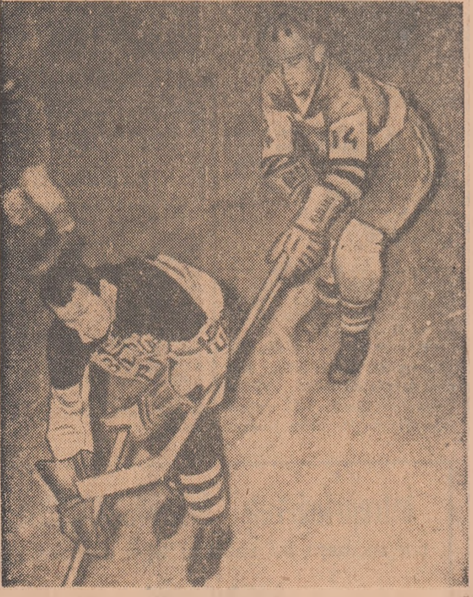
„Duet” sportiv, în partida de hochei disputată seara trecută, între echipele: Agronomia Cluj — Petrol Geologie.

CĂLIN ANTONESCU Programul de azi: ora 16.30: Steaua — Petrol Geologie; ora 18.45: Dinamo — Agronomia Cluj.