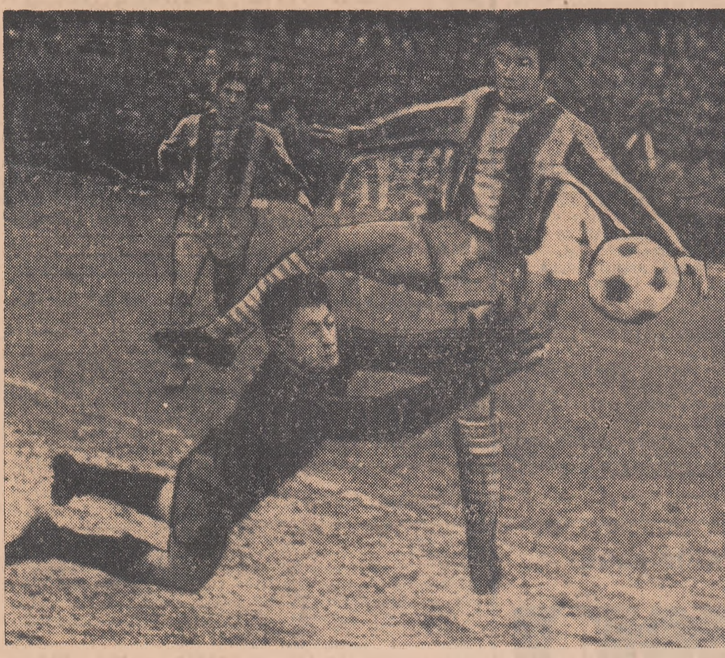
Datu, un adevărat inger păzitor, salvează în extremis...

Aș vrea să accept ed ecclpsa de formă e un fenomen foarte obișnuit în fotbal. Dar cum pot să accept ed e normal ca Steaua, Dinamo, Rapid (și nu numai ele) să fie mai aproape de lanterna decât de fostul candidat la retrogradare U.T.A.? Aș vrea să admit că echipele provinciale au ieșit întărite prin redobândirea dreptului legitim de a spune veto atunci când un jucător e furat de mirajul Capitalei. Dar cum pot să admit că e, totuși, normal ca în primele șase locuri să se afle doar echipe din afara Bucureștilor? Aș vrea să justifie pasa neagră a tuturor echipelor noastre „europene” (C.C.E., Cupa cupelor și C.O.T.), prin plusul de oboseală acumulată. Dar mi-e, iarăși, foarte greu să admit că e firesc ca aceste patru echipe să se afle în a doua jumătate a clasamentului, rezervându-și cu un egoism de neînțeles plin și dreptul la lanterna? Aș vrea să cred că U.T.A. și Craiova au, la urma urmei, dreptul de a fi în campionatul nostru ceea ce Milan și Juventus sau Real Madrid și Barcelona (nu respect ultimele clasamente) sunt în campionatul italian sau în cel spaniol. Dar mi-e, din nou, foarte greu să-mi explic cum o echipă reprezentivă o uzină de țesătoare și o alta provenind dintr-un institut agronomic, plus un I.S.E., reușesc să privească de sus echipe cu temelii organizatorice infinite mai solide? Aș vrea să susțin cu toată arderea că principul jucătorului consacrat este un