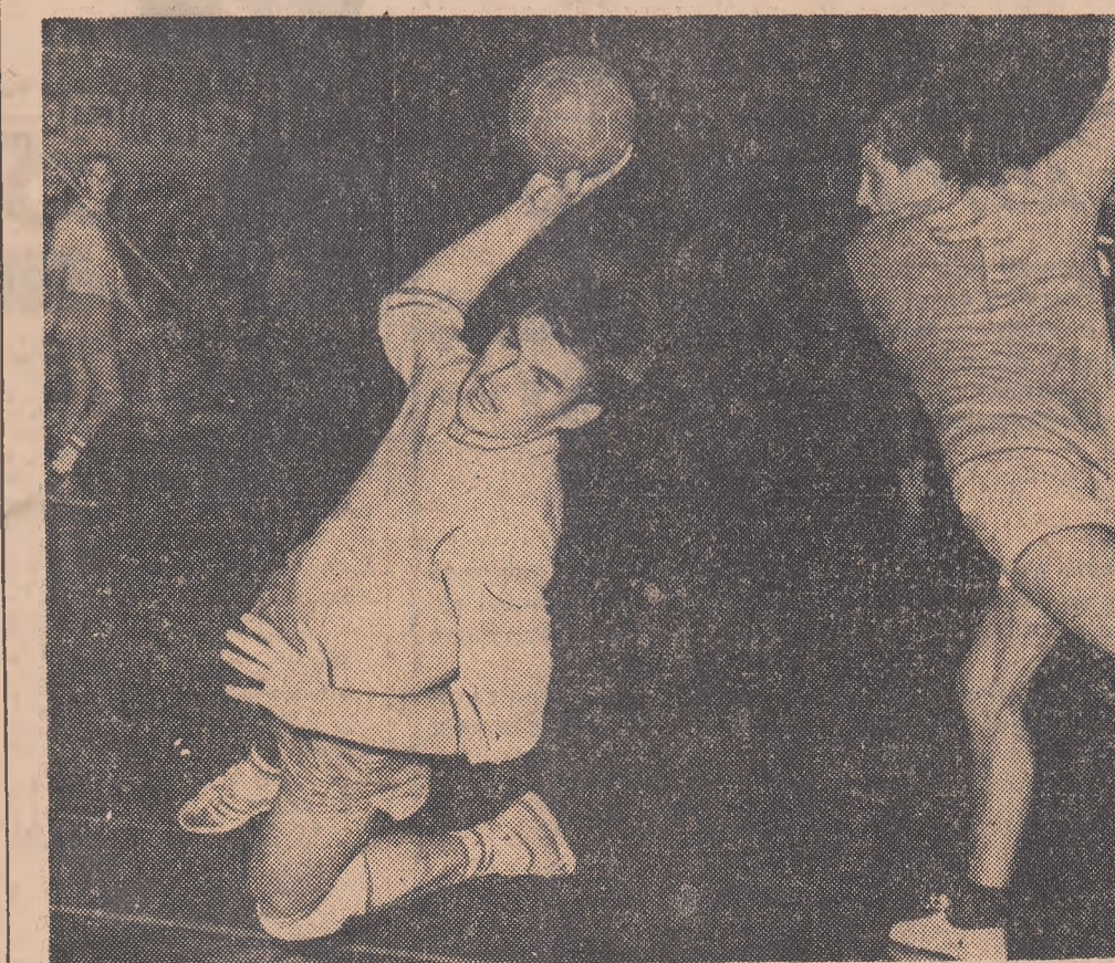
Imagine din partida celor două selecționate românești desfășurată așază în „Cupa orașului București”

minate de dorința realizării primei victorii în actualul turneu. Meciul a început năvalnic, jucătorii ambelor echipe înțînd atacuri în serie, multe dintre ele materializate prompt și pe tabela de marcaj. Cei care au înscris primii și au păstrat un ușor avantaj de-a lungul celei dintîi reprize au fost handbaliștii unguri. Selecționata iiberică însă, a recuperat de fiecare dată diferența, reușind să încheie repriza cu un pasiv de numai un gol. În min. 32, Morales, în aclamațiile sălii, a adus egalarea și, din acest moment, spaniolii au stăpînit partida. Minut cu minut ei au pus la grea încercare poarta apărată de... Adorian I, desprînzîndu-se încet, dar sigur, în cîștigătorii unguri. Fluietul final al arbitrului Tircu l-a găsit cu un avantaj de 4 puncte; scor final: 19-15 (7-8) — pe deplin meritat după evoluția lor spectaculoasă.