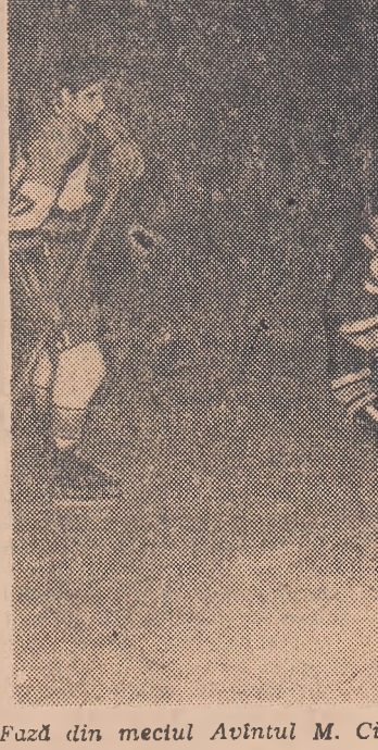
Fază din meciul Avintul M. Ciuc—Agronomia Cluj, desfășurat în deschiderea derbyului Dinamo—Steaua