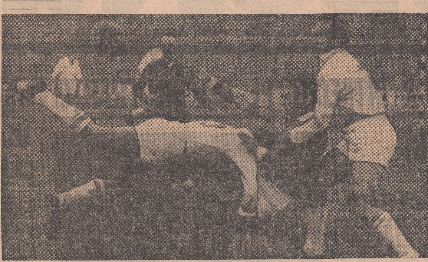
Necrușătorul placaj al lui Șerban...