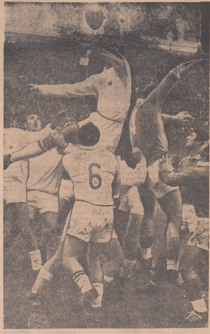
Dispută fără concesi în tușă