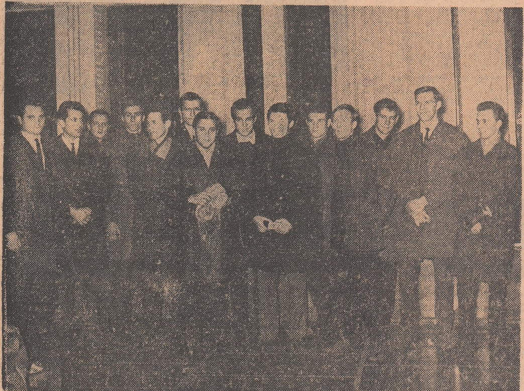
Selecționata de handbal a R. D. Germana la câteva clipe după sosirea pe aeroportul Băneasa.

Astăzi-seară, echipa reprezentativă de handbal a României se află în fața unui nou examen: întâlnirea cu selecționata Republicii Democratice Germane.