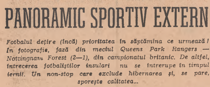
(Citiți în pagina a 4-a, panoramicul sportiv extern)