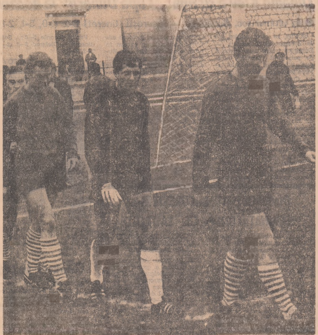
U.T.A. pășește pe gazon încrezătoare, ca de obicei, în forțele ei...

Revenind la actuala situație a formației campioane, ne amintim de sincerele deștalări făcute nouă de antrenorii echipei după jocul cu Farul. „Stim, am intuit mai de mult, se impunea să efectuăm ceva schimbări în formație. N-am fi avut mai puține puncte ca azi. Cineva ar fi fost, însă, îndreptățit să ne spună: vedeți, dacă ați schimbat formația campioană...”