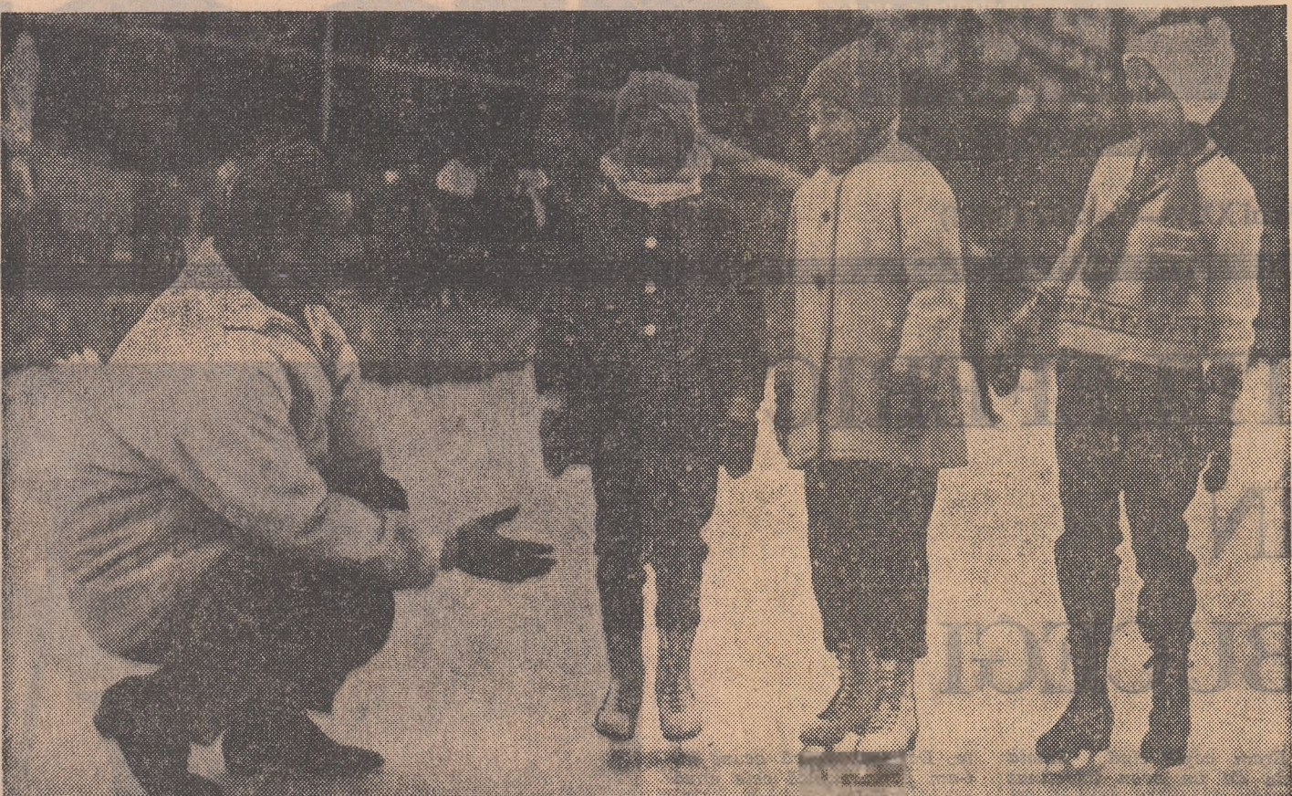
Timpul geros din ultimele zile a favorizat amenajarea, în întreaga țară, a numeroase patinoare naturale, prilej de bucurie pentru iubitorii patinajului. Iată-le pe micuțele vitioare campioane la primii pași pe gheață...