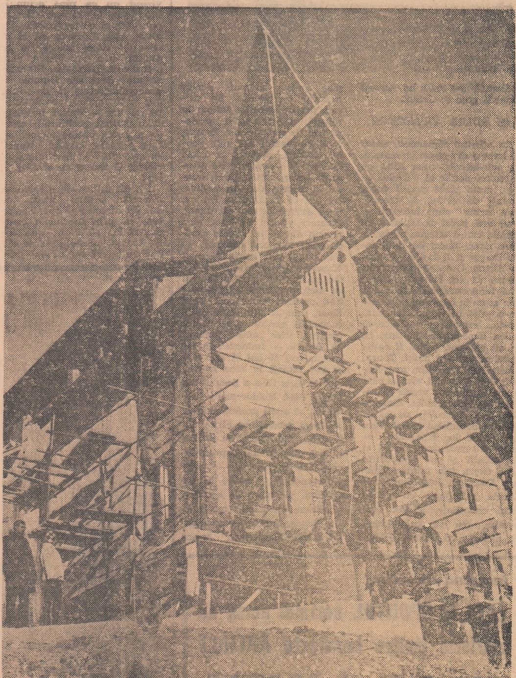
Un nou loc de popas pentru turiștii și amatorii de schi care vizitează Predealul va fi gata — destul de curînd, sperăm — să-și primească oaspetele. Este hotelul turistic cu o capacitate de 100 de locuri, construit în apropierea stației superioare a dublului teleferic de la Clăbucet.

● Controlul tehnic al automobilelor mai vechi de 3 ani este obligatoriu în Suedia. Dintr-un număr de 621 de mașini controlate, 66% au fost declarate „sănătoase”, 31,9% au fost trimise la garaj pentru reparații, iar 1,3% au fost scoase din circulație.