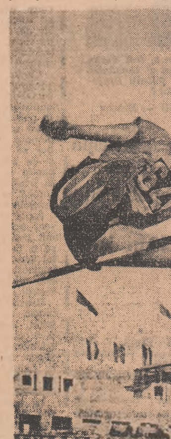
Fotografia istorică a săriturii de 1,91 m — recordul mondial al Iolande Balaz-Söter, realizat la Sofia, în iulie 1961

unde indicau angajamentele lui. Ca principiu, pregătirea din 1968 a lotului olimpic s-a desfășurat cu rezultate bune, sub formă descentralizată, pînă în luna iulie. Procedind astfel și în viitor, antrenorii și conducerea secțiilor de atletism vor avea toată responsabilitatea pentru realizarea integrală a planurilor de pregătire a atleților. Se impune, însă, o și mai bună coordonare a muncii din partea federației, care va trebui să urmărească asigurarea tuturor celor necesare pregătirii pe bazele de atletism. Ca și în acest an, pentru 1969, au fost întocmite listele cu normele de intrare în loturile republicane, europene și olimpice, precum și reglementarea selecționării pentru aceste loturi, pentru participarea internațională și pentru formarea echipelor reprezentative. În această direcție vom și mai categorici în respectarea principiilor stabilite și nu vom