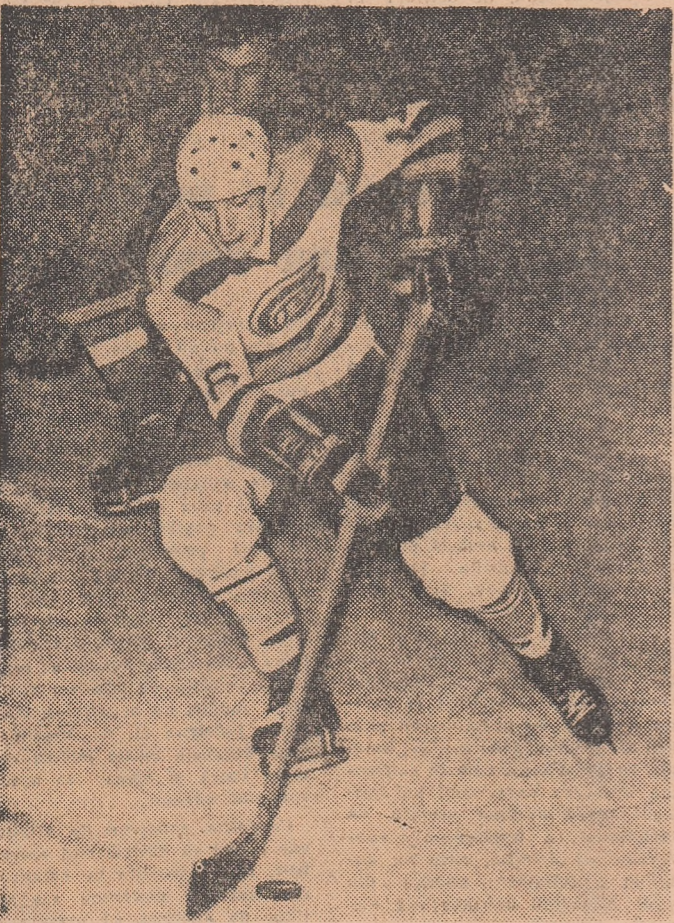
Oțelul (Agronomia Cluj) protejind pucul într-unul din meciurile susținute de echipa sa în turul trei al campionatului național de hochei