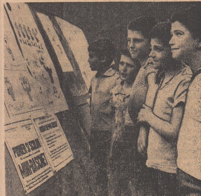
De miine pînă luni, Capitala va găzdui turneele finale ale „Cupei Federației” la mîmbaschet, competiție care reunește pe cei mai harnici și talentați practicanți ai acestui joc sportiv. Înaintea întrecerilor, o recapitulare a principalelor reguli, prezentate în pliante atrăgătoare, este o condiție importantă pentru o bună comportare

Astăzi, cu începere de la ora 18, va avea loc în sala Dinamo din Capitală, un interesant concurs de gimnastică artistică, cu participarea sportivelor de la Universitatea București și Slavia Sofia. În echipa bulgară vor evolua cîteva dintre gimnastele care fac parte din prima reprezentativă a țării.