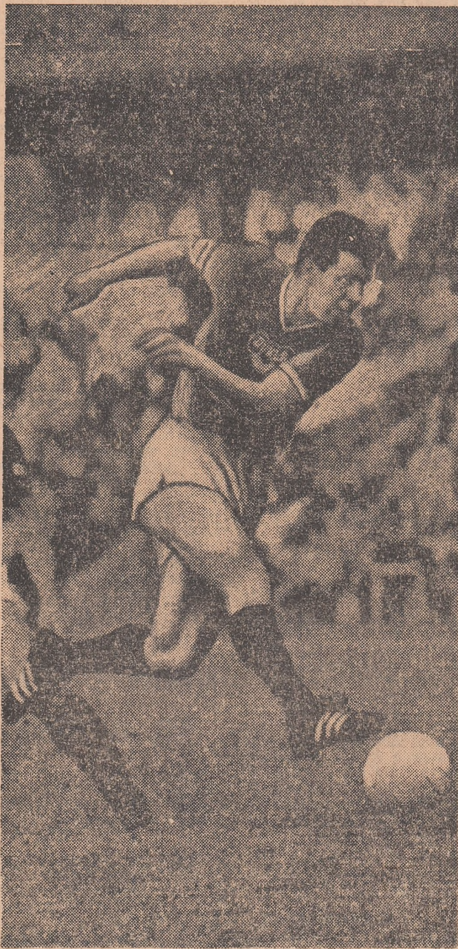
Masopust — la 35 de ani, unul dintre cei mai buni jucători ai „octogonalului” de la Santiago de Chile