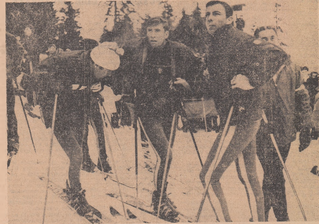
Vi-i mai amintii? Michel Arpin, Léo Lacroix și Pierre Stanus, trei dintre asii schiului francez, prezenți în 1966 la Concursul internațional al României. Ne va oferi sezonul anului 1969 prilejul să vedem pe pritrile Poienii Brașovului sau Bucegilor celebrități ale schiului mondial?