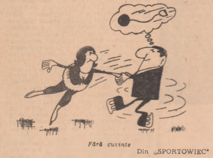
Fără cuvinte Din „SPORTOWIEC”