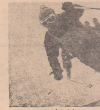
În slalom, spre primul loc

PREDEAL, 4 (prin telefon). De la trîmșii noștri. După mai multe zile de negură a început stațiunea, conferind paronamiei predele aspect de feerie. Pe culoarele albe dintre brazi de pe coasta Clăbucetului, cantitatea de lumină a favorizat invazia schiorilor, turștilor români și străini, a copiilor din tabere, însumat la vreo 2.000 de ciplici de lină, gulere de blană sau bluze impermeabile. Nici nu se putea o avanspremieră mai potrivită pentru deschiderea oficială a sezonului de schi 1969, decît acest concurs de selecție al juniorilor, care s-au bătut cu dirzenle pentru dreptul de a participa duminică la competiția rezervată consacraților. Adolescenții din toată țara,