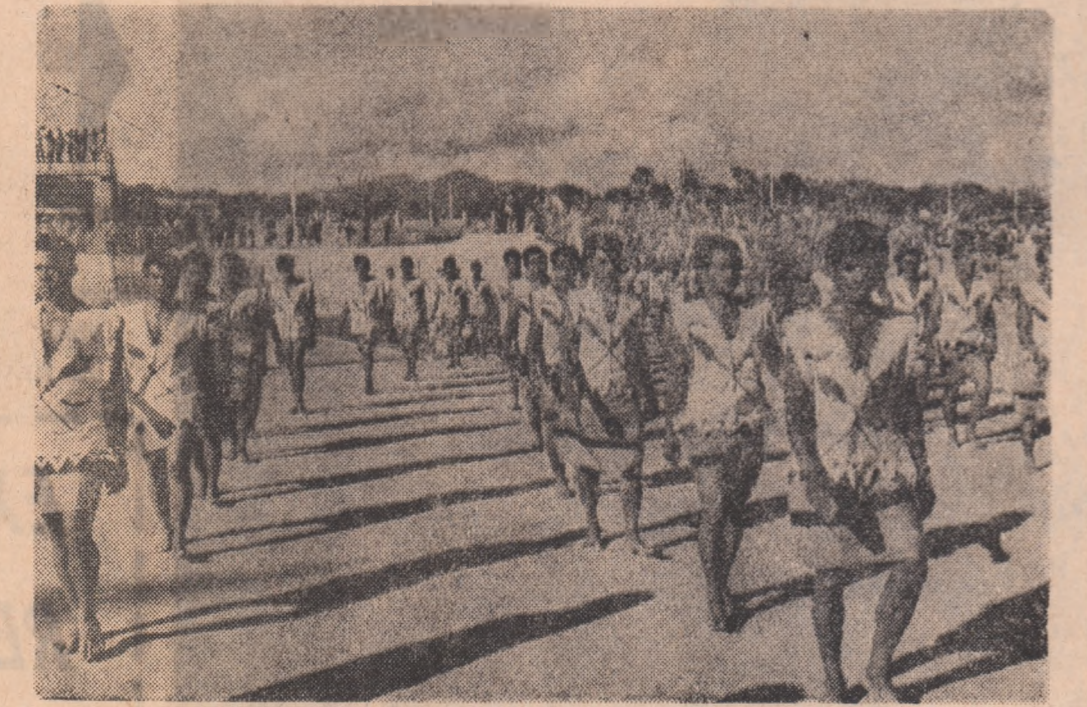
Sportivii din Samoa de Vest la festivitatea de deschidere a Jocurilor Pacificului