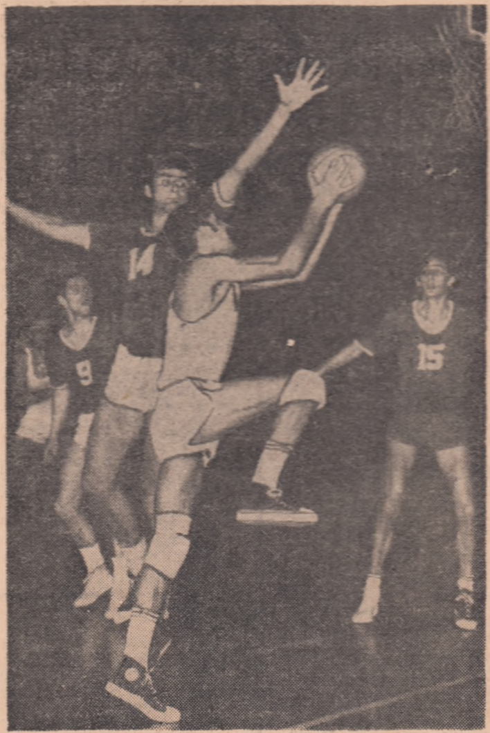
Aruncă la coș Cernea

— Ce s-a întimplat în meciul cu Bulgaria? După cum