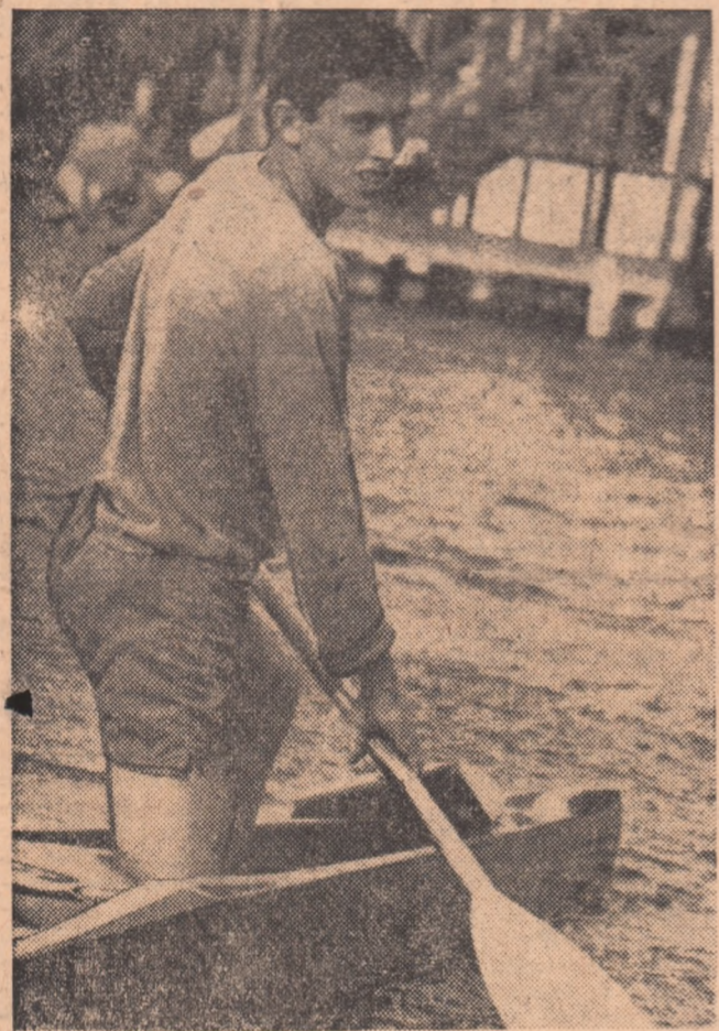
Ivan Patzaichin, marea revelație a anului 1968 la canoe

în competițiile cu caracter național, deținând autoritar înțietatea în anumite ramuri de sport. Totodată, ei au obținut rezultate strălucite și în arena internațională, la Jocurile Olimpice, campionatele mondiale, europene și balcanice, ridicând valoarea