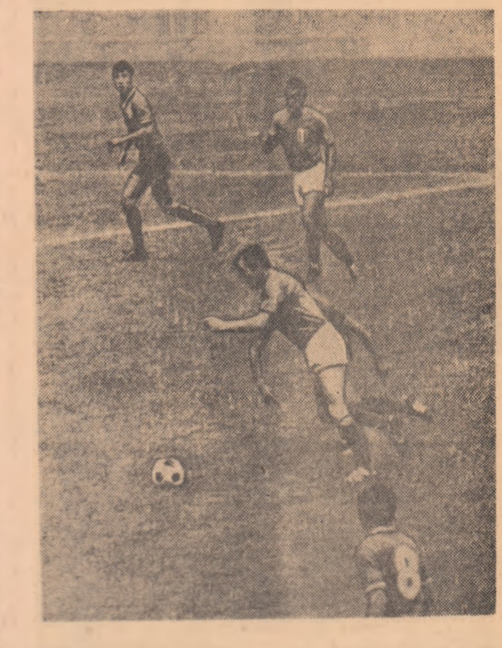
Imagine din meciul Franța — Mexic, considerat ca una dintre cele mai spectaculoase partide ale turneului... Horlaville, unul dintre cei mai buni atacanți francezi, trece în dribling spre poarta mexicană, asistat de coechipierul său Kanyan. Presa franceză scria că scorul cel mai fidel al partidei ar fi fost 6-5 pentru Franța...

mîntă că se medalia fotbal vioroază ci 16 medali la lu-tîng sau călărie.”