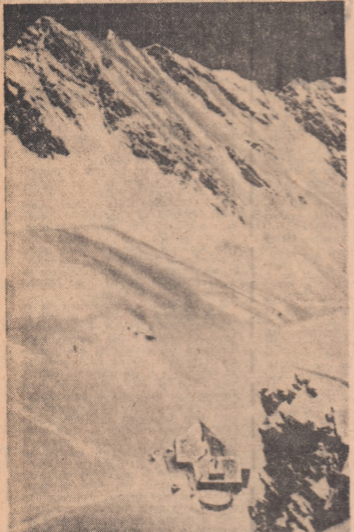
În căldarea Bilei, vor apare în anii următori noi locuri de popas pentru turiști și amatorii de schi