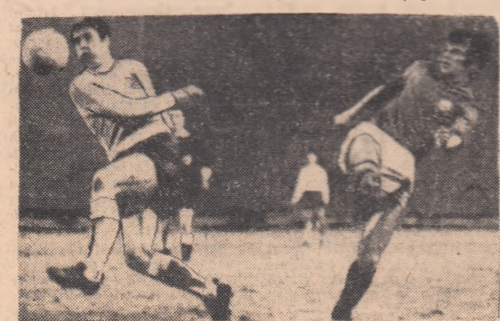
Hurst și Boc își dispută cu îndrăgire balonul. Fază din meciul Anglia—România, disputat miercuri seara pe Wembley

Un telefon la aeroportul Băneasa și orice semn de întrebare avea să dispară. Dar nu în