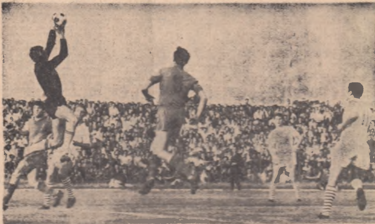
Pitbullul se năvălește printre orășele care în anul din urmă s-au îmbogățit cu stațiunile de mare capacitate. Un sportiv eficient dat deosebirea sportului de performanță.

„Succesul sportivilor români la Olimpiada mexicană, concretizat în cele 13 medalii cucerite, creează pe lângă satisfacția unanimă, și o atmosferă de calm pentru a-bordarea critică a întregii perioade de pregătire. A doua obser-