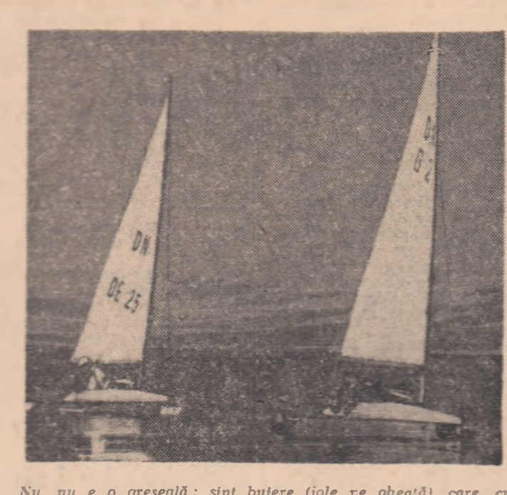
Nu, nu e o greșală: sint butere (iole pe gheață), care, cu 125 km/oră, se întrec pe lacul Steinhude. Care Snagorul...

Iarna nu-l împiedică și nici măcar nu-l... cumințește pe automobilistii rallyemen. La ora