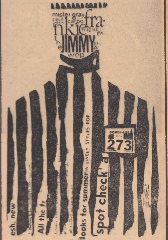
Desen de: N. CLAUDIU