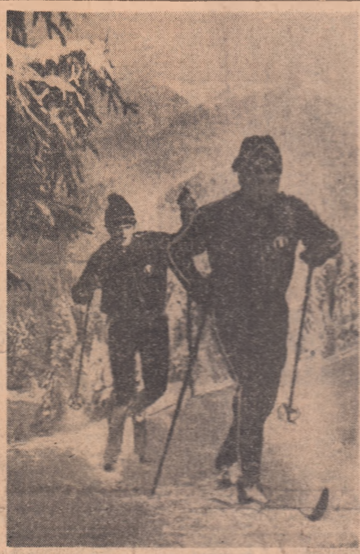
Schiori de la „U” Cluj la antrenamentul pe pista de fond. (Căuți în pag. a 2-a despre desfășurarea unor interese concursuri în ciuda din centrele montane ale țării.)