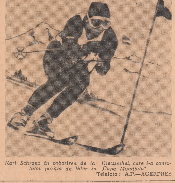
Karl Schranz în coborîrea de la Kitzbuhel, care i-a consolidat poziția de lider în „Cupa Mondială“.