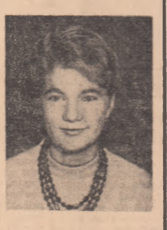
Solicitările lotului de jucătoare și prezența sa în competițiile internaționale a descoperit curînd, obligînd-o, totodată, să rezolve marea dilemă: în care baschetul a avut câștig de cauză.

Interviuează, în cadrul anchetei inițiate de ziar asupra „Compatibilității celor două activități ale studentului-sportiv: ÎNVĂȚĂTURĂ ȘI SPORTUL“.