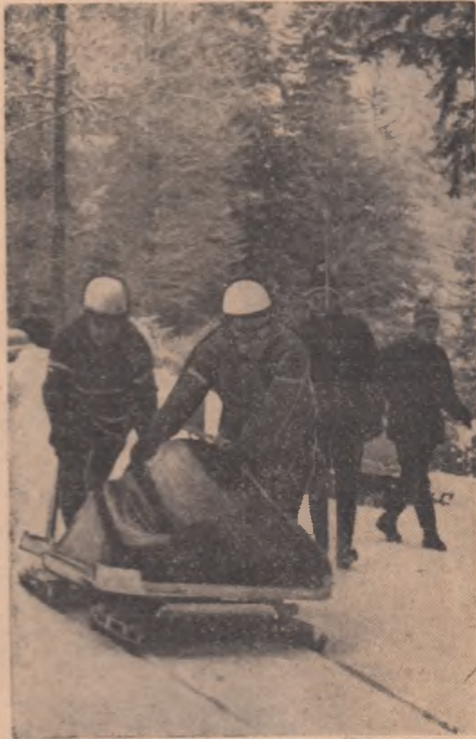
Trimisul nostru special la campionatele europene de bob, VICTOR BĂNCULESCU, transmite: