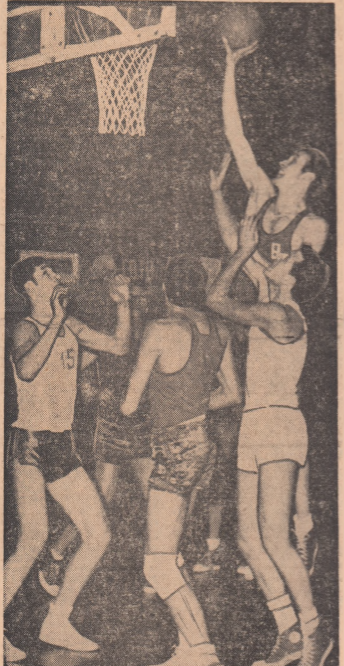
Imaginile de la ultimul antrenament al Stelei, desfășurat ieri, la Floresca