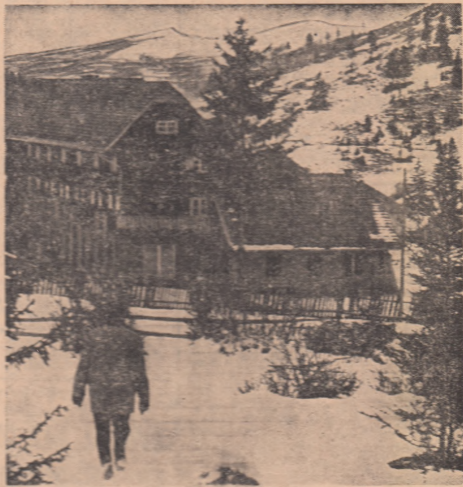
Cunoscuta stațiune a sporturilor de iarnă din țara Maramureșului, Borș. Peisajul de o rară frumusețe, pîrțile de schi, bazele turistice de aici atrag pe aceste meleaguri numeroși tineri și vîrstnici

Baschetbaliștii de la Steaua și-au mutat tabăra de pregătire la meciului cu Fides Partenope, din sala Pleșnița în sala Floresca. Ei au născut luni un joc de verificare în compania Politehnicii București, iar ieri au avut ca sparring-parteneri o selec-