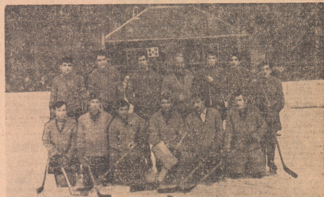
ASTAZI: AVINTUL MIERCUREA CIUC — BULGARIA (TINERET)

Sosiți miercuri în Capitală, tinerii jucători bulgari s-au deplasat în aceeași zi spre Miercurea Ciuc, unde își vor începe astăzi turneul în țara noastră, întîlnind echipa locală Avintul. În continuare, selecționata oaspe va evolua la Poiana Brașov, sîmbătă și duminică, în compania echipei de tineret a României.