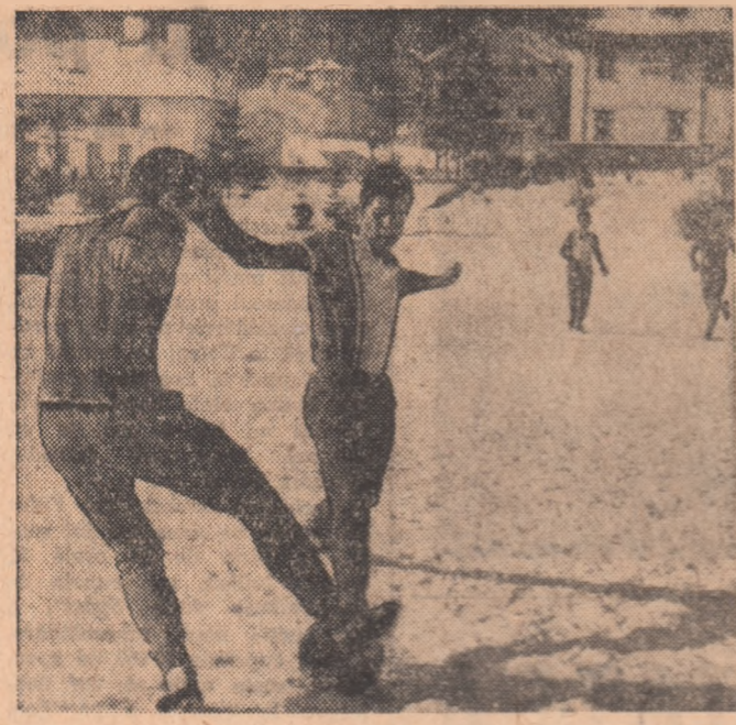
Fază de la ultimul antrenament, la Predeal, al echipei Crișul.