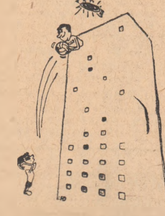
Ce faci, puștule? Parcă-ți e un atacant în fața porții!... (După „Uniunea Sovietică”)

Încă înainte începerti meciului de fotbal dintre echipele belgiene Hekelegem și Zelink, jucătorii și oficialii celor două formații și-au dat seama că au de-a face cu un arbitru deosebit de sever... Apa de la dus nu i s-a părut suficient de caldă, cutia farmaceutică a fost controlată foarte minuțios, mîngea a fost cîntărită. Dar ciudățenia acestui arbitru a atins punctul culminant cînd el nu a observat pe autorul unui fault comis de unul din jucătorii echipei locale asupra portarului formației adverse. După o îndelungată intrerupere a partidei, arbitrul s-a adresat căpitanului formației locale cu următoarele cuvinte: „Un asemenea fault se pedepsește cu eliminarea de pe teren. Infructiv nu l-am văzut pe autor, alege d-ta dintre jucători pe cel care trebuie exclus!” Căpitanul a ezitat o clipă, apoi l-a desemnat pe adevăratul vinovat, văcut de atîtea de toți spectatorii din tribune.