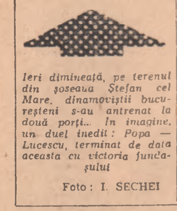
Ieri dimineață, pe terenul din șoseaua Stefan cel Mare, dinamoviștii bucureșteni s-au antrenat la două porți...

Constanța întreprinde un turneu în Bulgaria, urmând să susțină trei jocuri la 9, 12 și 16 februarie, cu Cerno More Varna și Toluhin, al treilea adversar fiind încă nedeterminat.