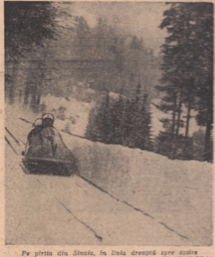
Pe pîrtia din Sinaia, în linia dreaptă spre soare.