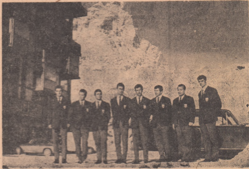
După încheierea întrecerilor de la Cervinia, unde au cucerit eventul de argint, boberii romîni cu pleacă în S.U.A. la Lake Placid, pentru a participa la campionatele mondiale programate pentru zilele de 15-16 februarie (proba de 4 persoane). Înaintea plecării, sportivii noștri au ținut să trimiță, prin inter- mediul ziarului, o plăcuță amintire din joia zilei Edelweiss unde au fost găzduiți. În spate se vede Muntele Cervinia (4484 m)

Noul continent primește cu simpatie pe solii sportului ro-