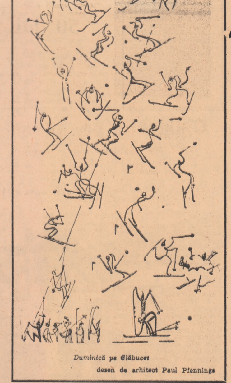
Duminică pe Clăbucet desen de arhitect Paul Pfenning