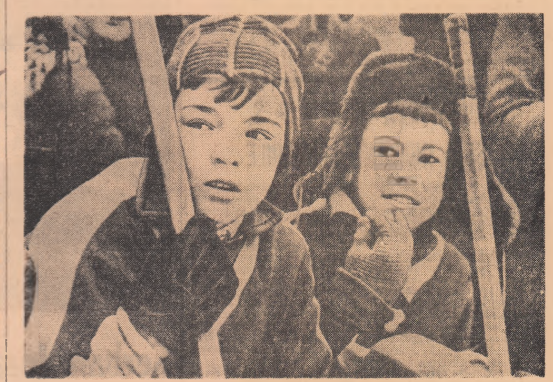
„Ai noștri atacă!”