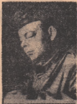
Jeune, în copilărie, și mai târziu, în timpul războiului...