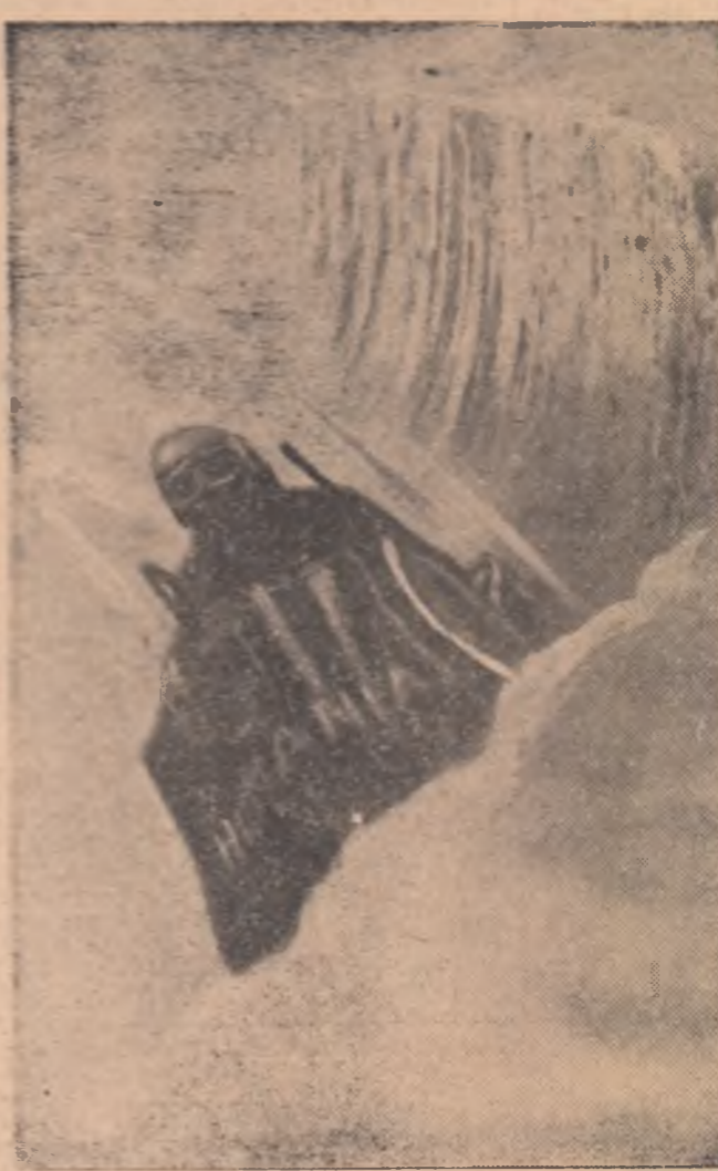
Principal era campionatul mondial „europenele” fiind o etapă în pregătirea sa.

Pentru noi, problema selecției echipajului se rezolvă cu cea a obținerii treptate a formei sportive a lui Panturu, al cărui obiectiv prin-