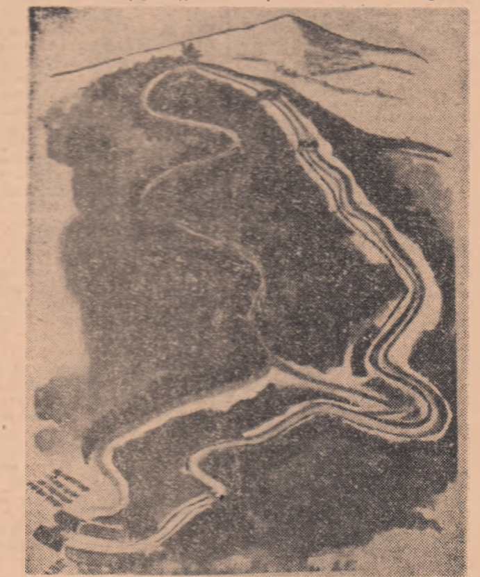
Pirția olimpică de bob de la Lake Placid, cu celebrul Zig-zag (în dreapta)

bată recordul pirții, stabilindu-l pentru moment la timpul de 1:08,7. Performanța aparține cuplului Paul Lacey — Robert Hatcher (S.U.A.). Pe americani îi taborează de aproape echipajele europene: De Zorio — Frassineti (Italia), Woi-