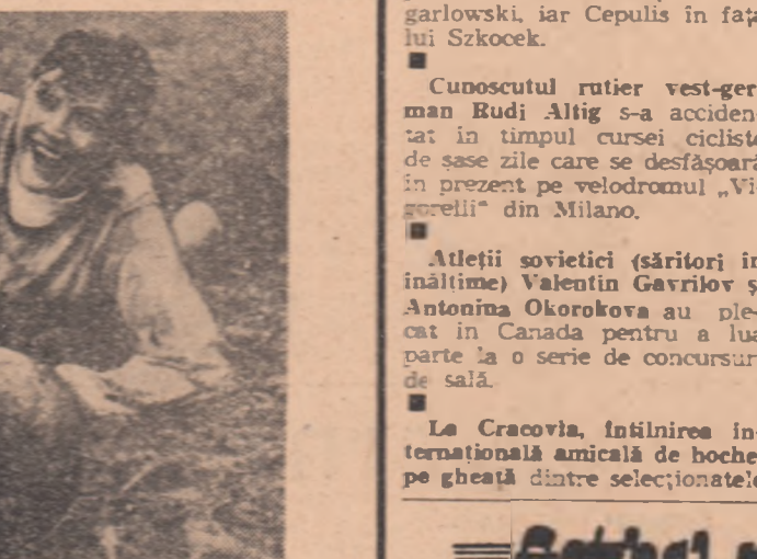
Sandie Shaw pe terenul de fotbal