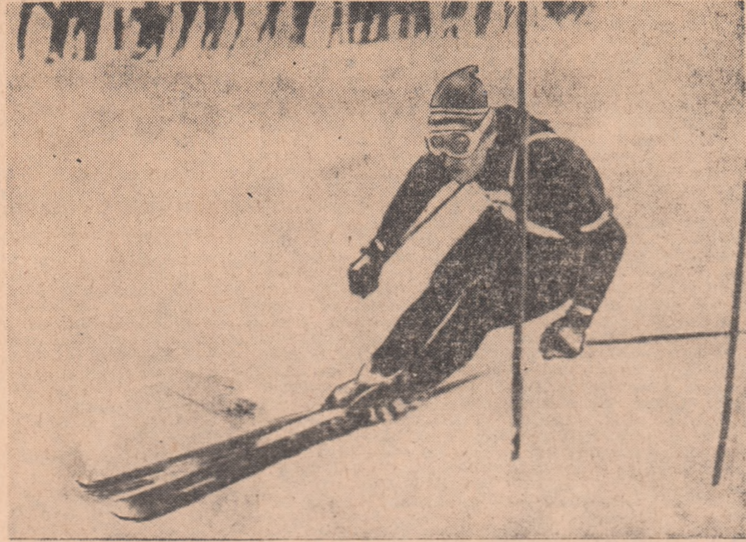
Pe pirtia de slalom special (1.250 m; 370 m diferență de nivel; 59 porți) de la Kranjska Gora (Iugoslavia), schiorul austriac Reinhardt Tritscher a obținut o prețioasă victorie care l-a adus pe locul III în Cupa Mondială.

Au fost poate cele mai emoționante momente în care merarii noștri sportivi au primit o căldă și sinceră manifestare de simpatie, de apreciere a izbînzii.