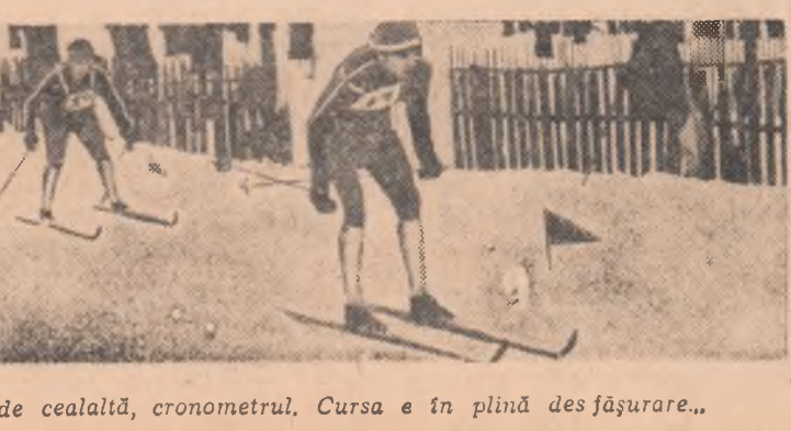
Deoparte adversarul, de cealaltă, cronometrul. Cursa e în plină desfășurare...