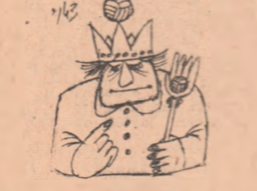
Deseno de M. POPESCU

Mine are loc tragera concursului excepțional Pronoexpres din 23 februarie la care se atribuie autoturisme în număr NELIMITAT: VOLGA, DACIA - 1100, MOSKVICI 408 cu 4 fururi și radio, SKODA 1000 M.B. și alte 10 autoturisme prin tragere la sorți. Se mai acordă premii în număr de valoare variabilă și premii fixe în bani. Cu bilete seria N de 30 lei puteteți participa la toate tragerile. Au mai rămas doar cîteva ore pentru procurarea biletelor. Tragera concursului excepțional Pronoexpres din 23 februarie 1969, va avea loc mine la București în sala din strada Doamnei 2 cu începere de la ora 11. Tragera va fi radiofuzată.