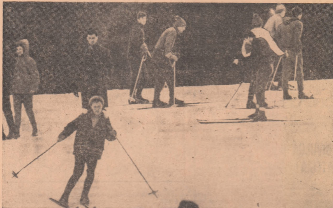
Studenți pe pîrtia de la Clăbucet