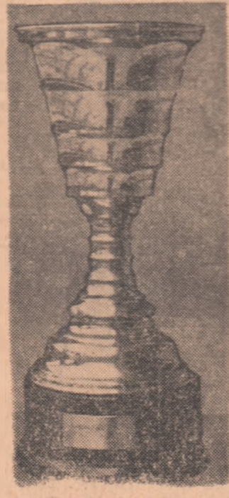
spectator, note care vor fi comunicate la sfîrșitul cronicii meciului respectiv. „Trofeul Petschowschi” va fi reprezentat printr-o cupă transmisibilă.

lebrului jucător al echipei Tottenham, electrocutat în cursul unei partide de golf, a revenit „fanilor” lui F. C. Liverpool. Suporterii echipei din Liverpool s-au dovedit cei mai fideli iubitori ai echipei lor, conducîndu-se după titlul celebrului glăgăr al formației Beatles, ridicat din orășul lor: „You'll never walk alone”, ceea ce ar suna în traducere „Voi nu veți juca niciodată singuri...” Revenînd la „Trofeul Petschowschi”, trebuie să menționăm că în cursa pentru obținerea lui vor intra inițial toate orașele care posedă echipe în prima divizie a țării, decernarea primului trofeu urmind să aibă loc nu la sfîrșitul unui an calendaristic ci la încheierea campionatului de fotbal. În ceea ce privește sistemul de acordare a calificativelor, acesta va consta în notarea (note de la 1 la 10) publicului