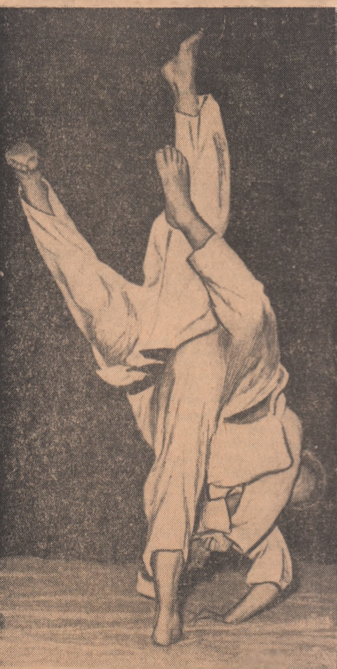
Uchi-mata, procedeu tehnic deosebit de spectaculos și nelipsit aproape în toate confruntările de judo.