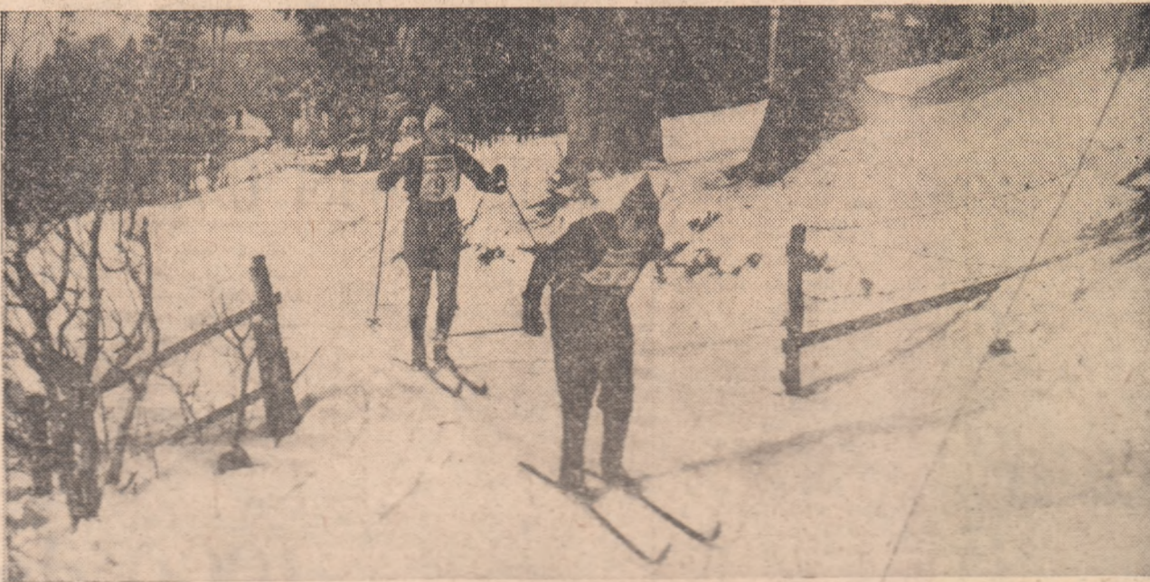
Aspect din timpul desfășurării probei de ștafetă băieți