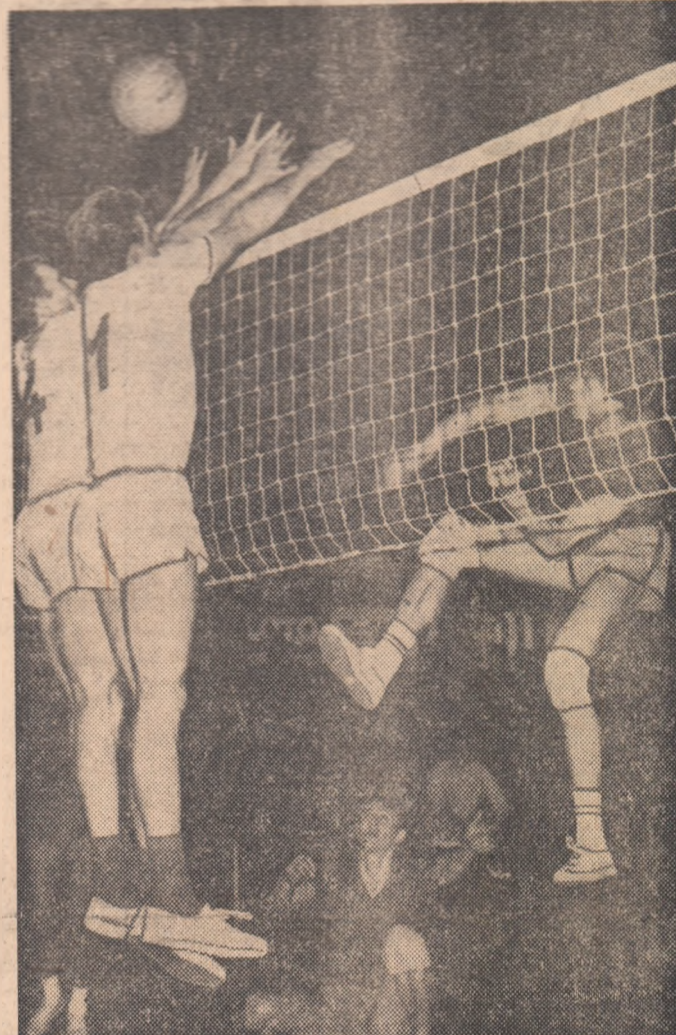
Stamate atacă exploziv și blocajul budapeștenilor, format cu întirziere de către Steiner și Csik, este depășit

Azi, de la ora 17, în sala Giulești, va avea loc returul partidei RAPID — 17 NEN-TORI Tirana, în cadrul optimilor de finală ale C.C.E. la volei feminin.