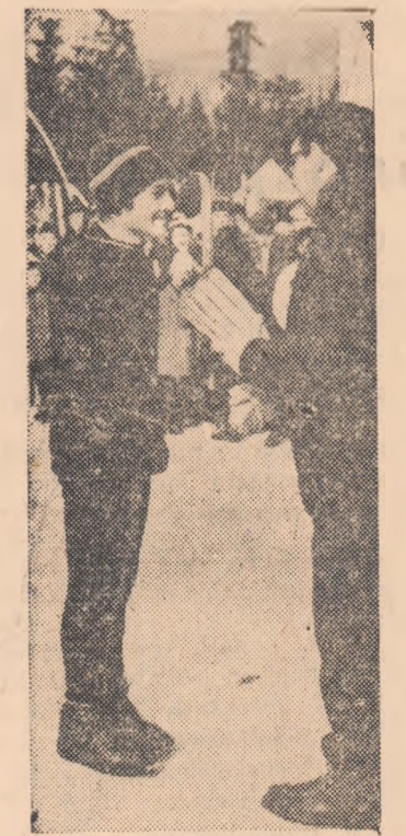
„Cupa Sportul” este oferită celui mai tehnic schior participant la concursul U.A.S.R.