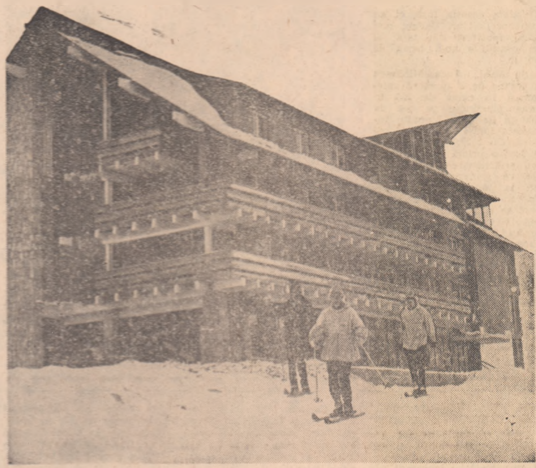
Splendidul Hotel de la Olăbucet-plecare este o gazdă extrem de ospitalieră pentru pasionații schiului

Și voi puteți deveni scrierim de performanță!