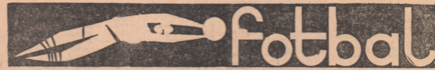
16-MILE CUPEI ROMÂNIEI SE DISPUTĂ LA 5 MARTIE

ANINA O veste bună pentru Fotbalistica Iasi, asociației Minerului: terenul este excelent. (Gh. Crăciun).