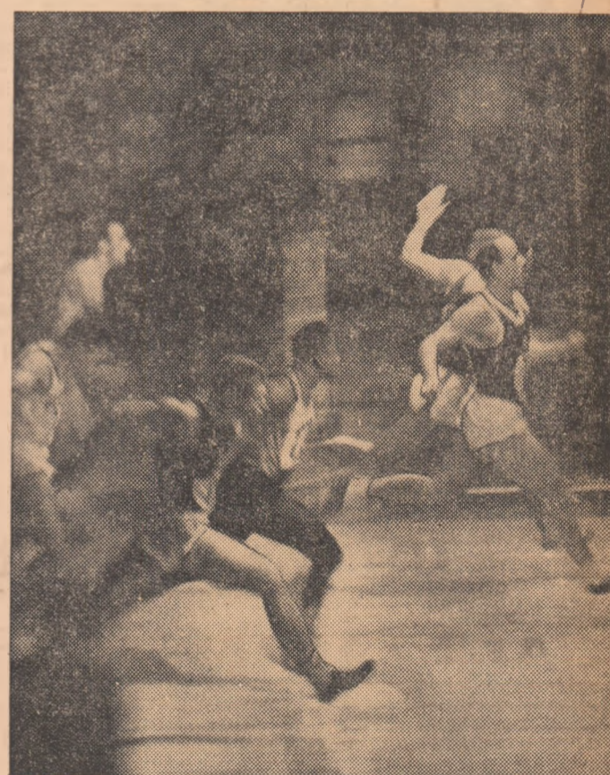
Finiș într-o serie la 50 m.

ASTĂ-SEARĂ, LA CONSTANȚA: FARUL — SELECȚIONATA ALGERIEI, LA BOX