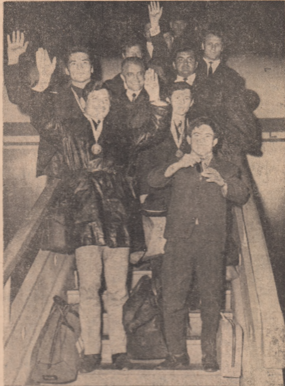
Instanțarea nocturnă la aerodromul Băneasa. După o comportare excelentă, luptătorii români s-au înscris în competiția de la Mar del Plata. Intimpinați cu căldură de membrii familiilor și de un mare număr de iubitori ai sportului, „tricolorii” coboară fericiți din avionul care le purtase, aproape 15000 de km, de la Mar del Plata la București.