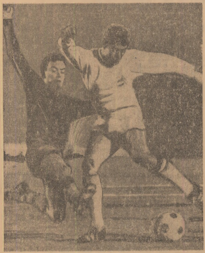
Bisкуп de la F. C. Köln (în tricou alb) în luptă cu un fundas spaniol. Fază din semifinalele Cupei Cupelor dintre F. C. Köln — F. C. Barcelona (2-2) desfășurată miercuri seara.