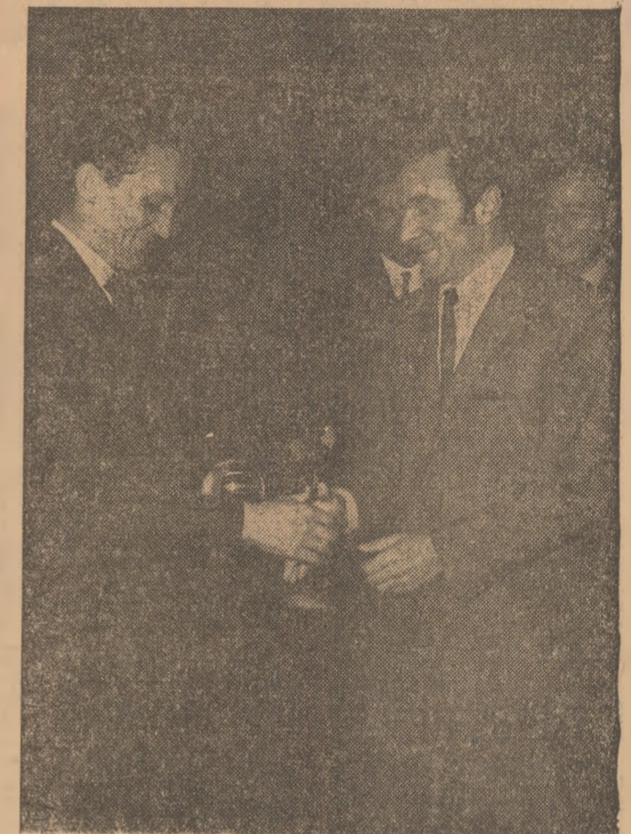
Florian Albert (în stînga fotografiei noastre) celebrul echipier al lui Ferencvaros, primind „Balom de aur”, acordat de revista franceză de specialitate „France-Football” celui mai bun fotbalist al anului 1967

Sărbătorile legate de aniversarea a 70 de ani de la fondarea clubului au și început. La 14 ianuarie a avut loc ședința comemorativă și reuniunile festive se vor desfășura pe parcursul întregii