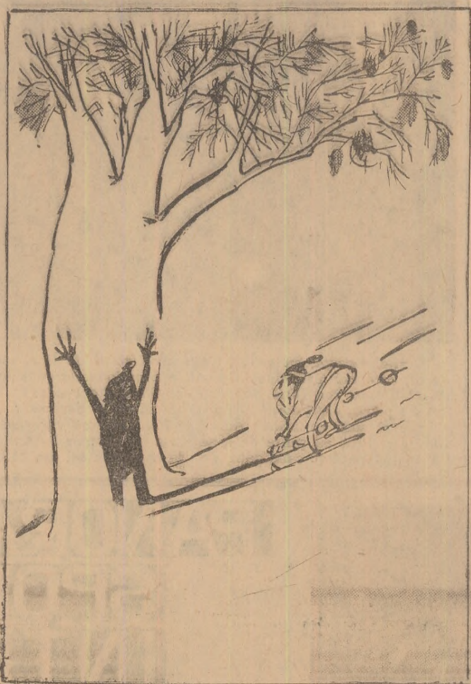
Fără cuvinte...