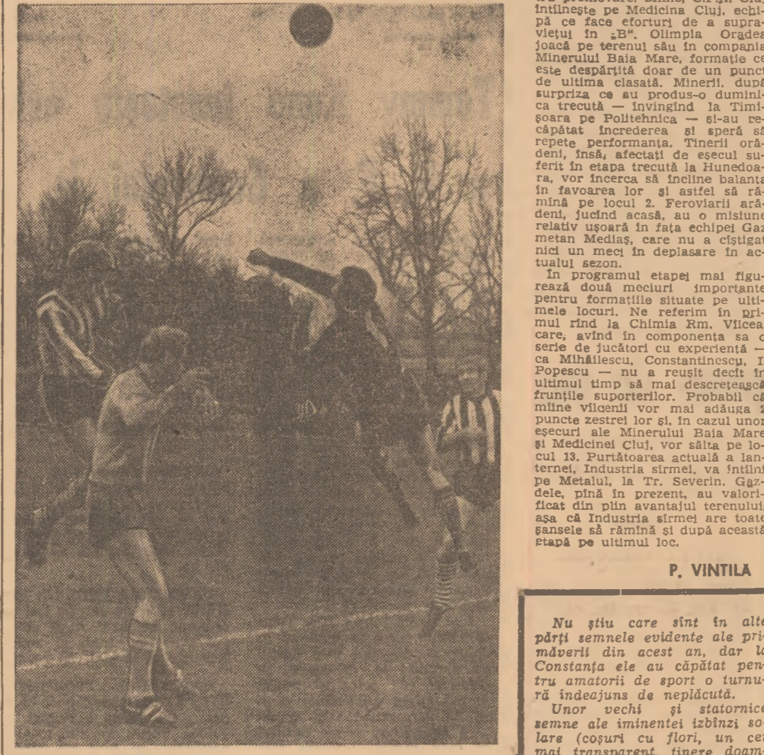
Un atac al Politehnicii, respina de portarul brașovean (jază din meciul Politehnica București — Metrom Brasov)

C. F. R. Sighișoara va juca două etape pe alte terenuri În ultima sa ședință, Comisia de competiții și disciplină a F. R. Fotbal a hotărît ridicarea dreptului de organizare pe timp de două etape echipei C.F.R. Sighișoara, deoarece în timpul partidei C.F.R. Sighișoara — Chimia Făgăraș unul dintre arbitrii de linie a fost lovit cu o piatră, iar după terminarea jocului a fost molestat de efiva spectatorilor.