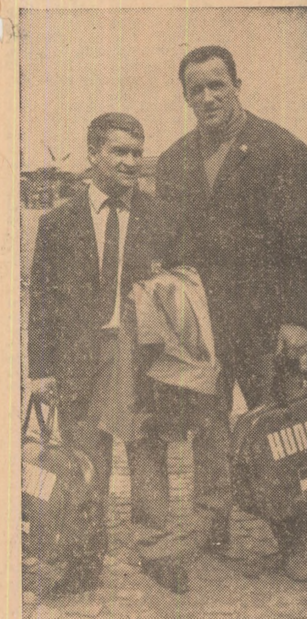
Doi dintre cei mai valoroși halterofili maghiari la sosire pe aeroportul Băneasa: Imre Földi și Geza Toth.