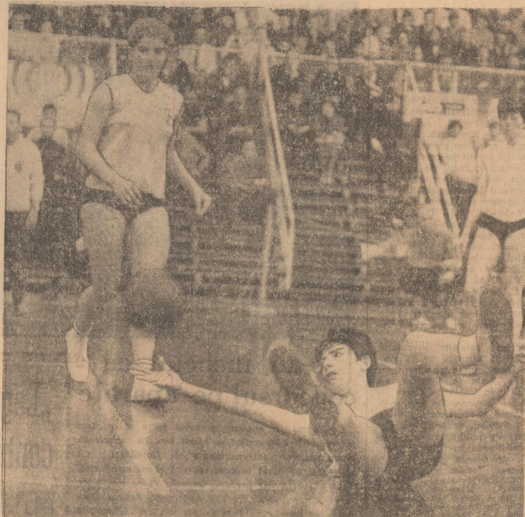
Cu tot efortul Iiei Iliescu, mingea expedită de rapidiste nu va mai putea fi recuperată.

Clasamentul general: 1. București 57 p. 2. Dolj 18 p. 3. Brașov 18 p.