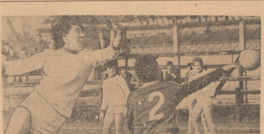
O nouă încercare a jucătoarei Ofelea de-a reduce din handicap. Fază din meciul Rapid-Progressul. Citiți în pag. 2-a, cronicile etapei de ieri.

● F. C. Argeș invinsă, din nou, pe potou ● „Draw”-uri neașteptate la Tg. Mureș și Cluj ● Scoruri categorice la Craiova și Petroșeni