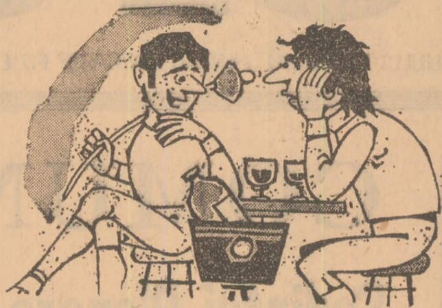
Ce-i spunem antrenorului, că simțeam cam îmbuforați la față? - Că am făcut... încălzirea.