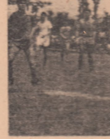
Duel aerian pentru balon, rezultat cu succes de portarul consilierilor. Fez din meciul de divizia C Autoturul București-I.T.C. Constanța.

ANGLIA A DEBUTAT CU UN SCOR ALB ÎN MEXIC CIUDADA DE MEXICO 2 (Agerget). — Peste 100.000 de spectatori au asistat pe stadionul Azteca la meciul amical dintre selecționata Angliei și Mexicului. Partida s-a terminat la egalitate: 0-0, după un joc în care gazdele n-au știut să-și concretizeze superioritatea teritorială. Cea mai mare ocazie a fost ratată de Gonzalez, în minutul 42, când, singur cu portarul West, a tras pe lângă bară. Au evoluat formațiile: ANGLIA: West—Newton, Cooper, Mullery, Labone, Moore, Lee, Ball, B. Charlton, Hurst, Peters. MEXIC: Castrejón—Calejandrez, Pena, Munoz, Perez, Gonzalez, Munguia, Bustos, Borja, Estrada, Victorina. Cele două selecționate se vor întâlni din nou miercuri la Guadaluajara. Apoi echipa Angliei va juca în Uruguay și Brazilia.