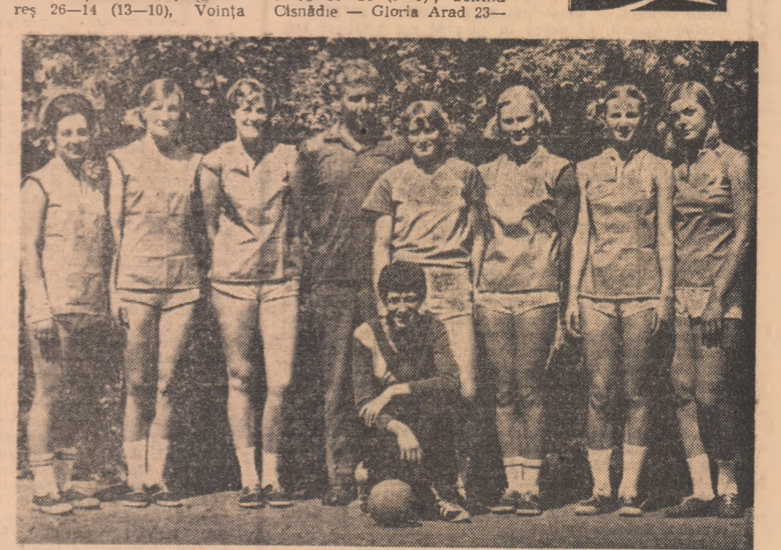
Iată echipa UNIVERSITATEA TIMIȘOARA, campioana țării la handbal pe anul 1968...