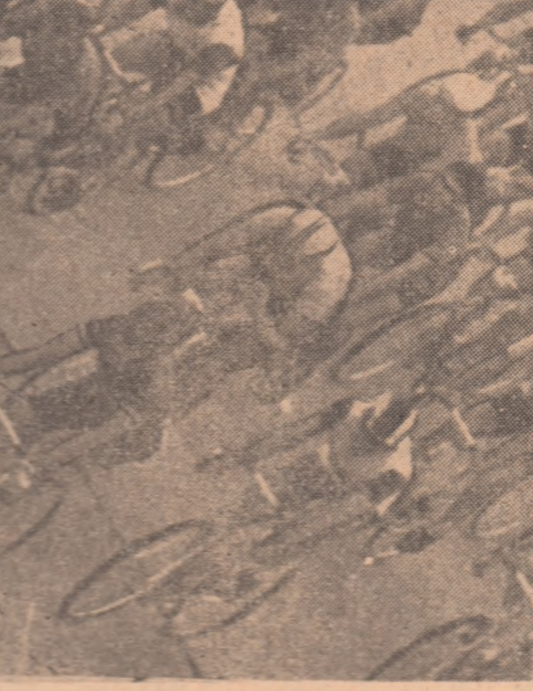
Grosul plutonului luat în „plunge” de fotoreporterul nostru