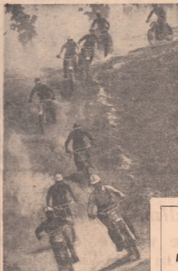
Motorciclistul coboară în „rapel“ una dintre pantele abrupte ale traseului din Panteleimon