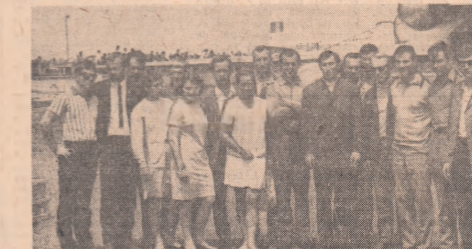
Lotul sovietic, la sosirea în București

laureați ai diferitelor campionate mondiale sau continentale. O scurtă declarație a cunoscutului antrenor sovietic Alexander Ștaev (fost campion mondial și european): „AM VENIT LA FRUMOSA DV, REGATA SNAGOV CU UN LOT DE APROAPE 40 DE SPORTIVI. CUNOĂȘTEM VALOAREA PUTERNICILOR CANOISTI ȘI CAIACTIȘTI ROMÂNI. VREM SĂ PARTICIPAM ÎN ASA FEL CA ÎNȚEGERILE SĂ FIE INTERESANTE PENTRU TOȚI.“