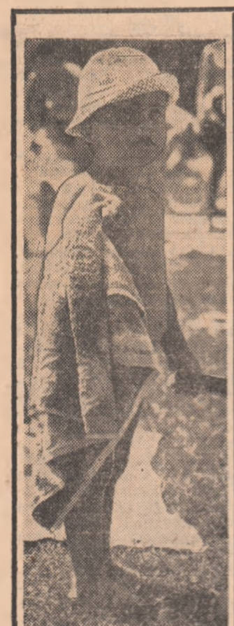
Cînd prosopele n-o sîmăi mai servească drept halat și-o să cresc mare, am să ajung un campion vestit — pare să spună piticul și înfometatul învîtător, la capătul unei noi ore de ucenicie în atelierul bazinului

Organizarea, la foarte puțin timp după încheierea Turului României, a unui concurs cicloturistic dedicat celor mai mici rutieri a fost, am zice, un fel de pradă a ștafetei în... pedalele viitoarelor noastre speranțe.