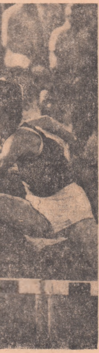
Karin Balzer a egalat în cadrul campionatelor R. D. Germane propriul său record mondial pe 100 m garduri: 13,0

Pongraț și Mironov aveau să se claseze imediat după grupul finalisților, pe locurile 7-12. Ceea ce, pentru actuala etapă de pregătire a spadasiinilor noștri, reprezintă o promisiune. Sepeșu a rămas în turul II, Moldanschi și Al. Istrate în primul tur. Următoarea probă — cea de floretă femei. Datorită bunei comportări la individuale (unde a avut și o trăgătoare în primele trei locuri, pe Ileana Drîmbă), România beneficiază de o serie foarte convenabilă împreună cu echipa secundă a Uniunii Sovietice, formațiile Cubei și Republicii Democratice Germane. Un indiciu că ea va repeta — cel puțin — performanța floretisților, ocuparea locului 2 în clasamentul final. Proba cu care se va încheia turneul va fi spada (echipe).