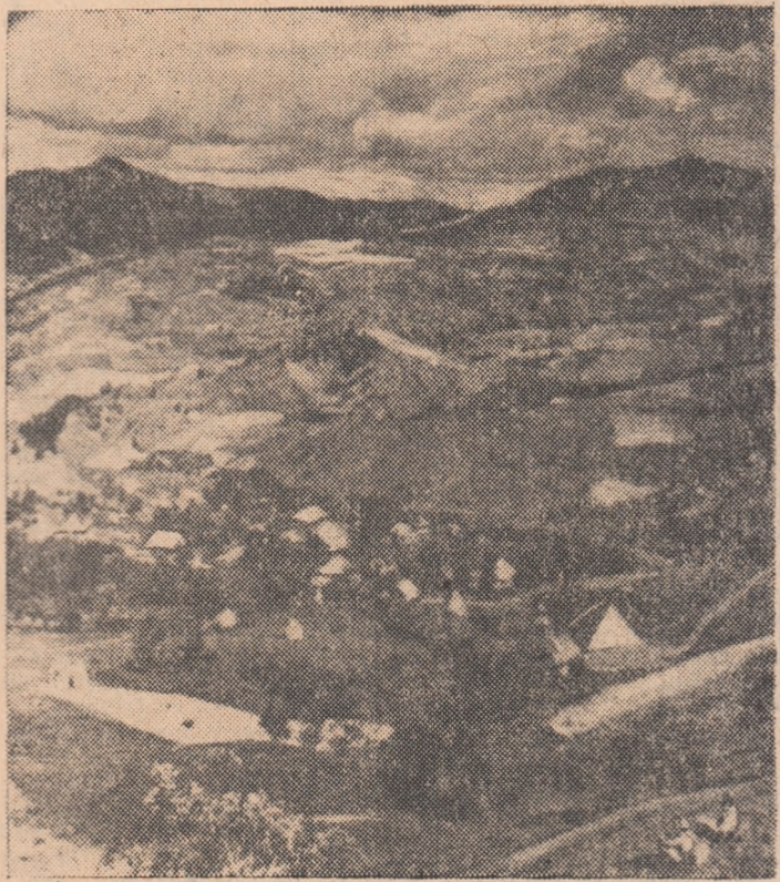
De pe culmile munților, care mărginesc văi largi și însoțite, pasionatul de drumeție descoperă, la tot pasul, comori de frumusețe, zămislite de om și natură.