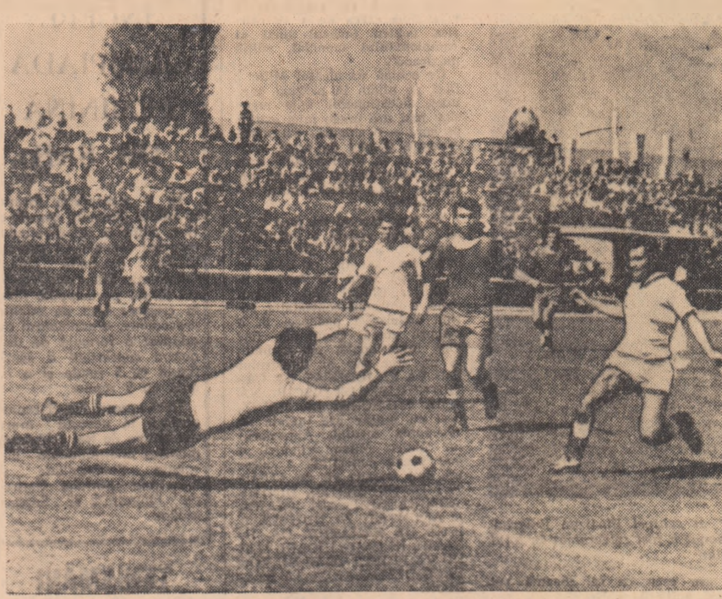
Una dintre actiunile ofensive ale inaintasilor de la Laromet. (Faza din meciul Laromet Bucuresti - Cimentul Medgidia, din campionatul diviziei C).