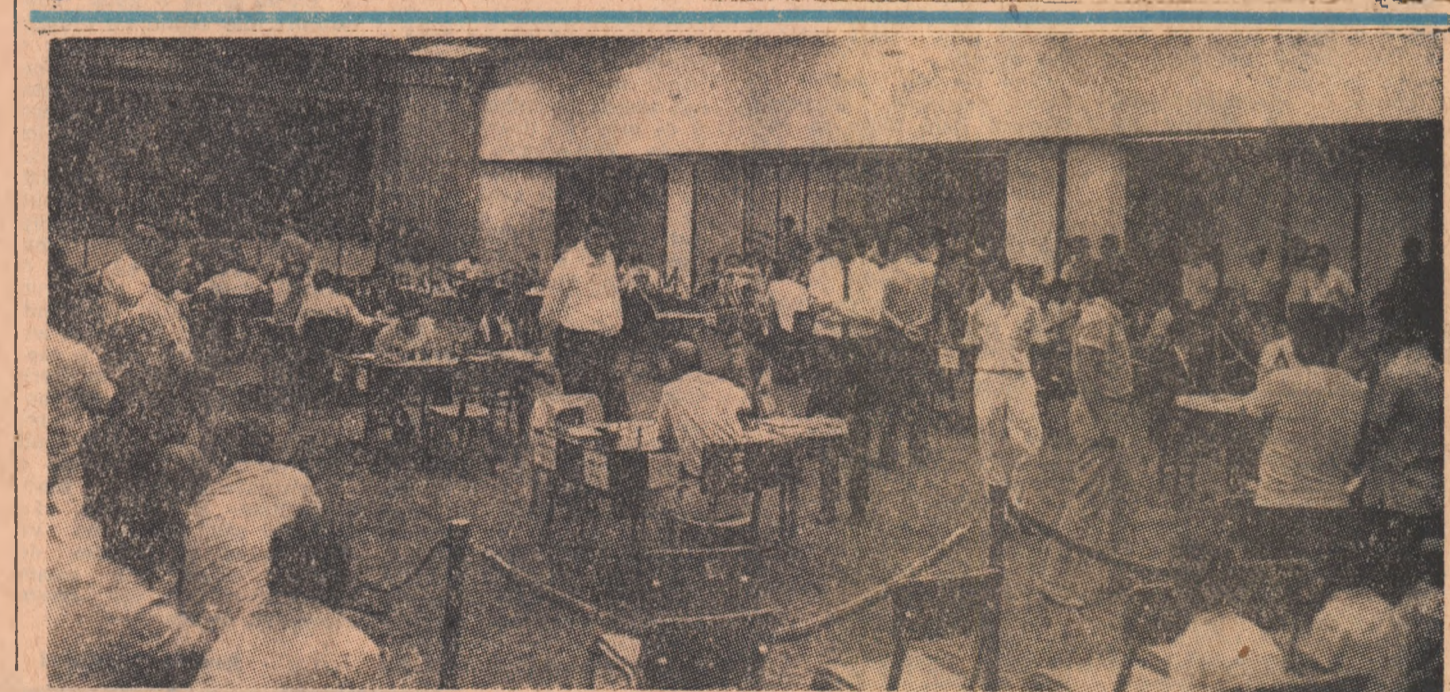
Un aspect din sala de festivități a hotelului „Habana libre” din capitala Cuhei, unde se desfășoară întrecerile tradiționale ale turneului internațional de șah „Memorialul Capablanca”