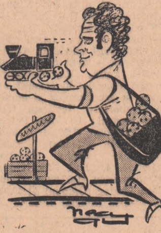
MARIN BĂRBULESCU Desene de Neagu RADULESCU