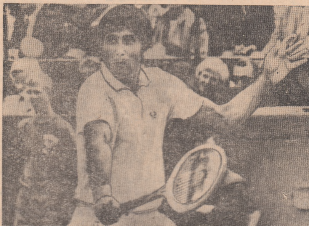
Ilie Năstase în timpul extraordinarei sale paride cu Stan Smith, din finala „Cupei Davis”.

luat startul, cu șapte decenții în urmă, întrecerile pentru trofeul său suprem. Poate că, într-adevăr, americanii redescoperă acum tenisul, cel adevărat, în care nu numai forța brațului decide pe cel mai bun. Și poate că tocmai de