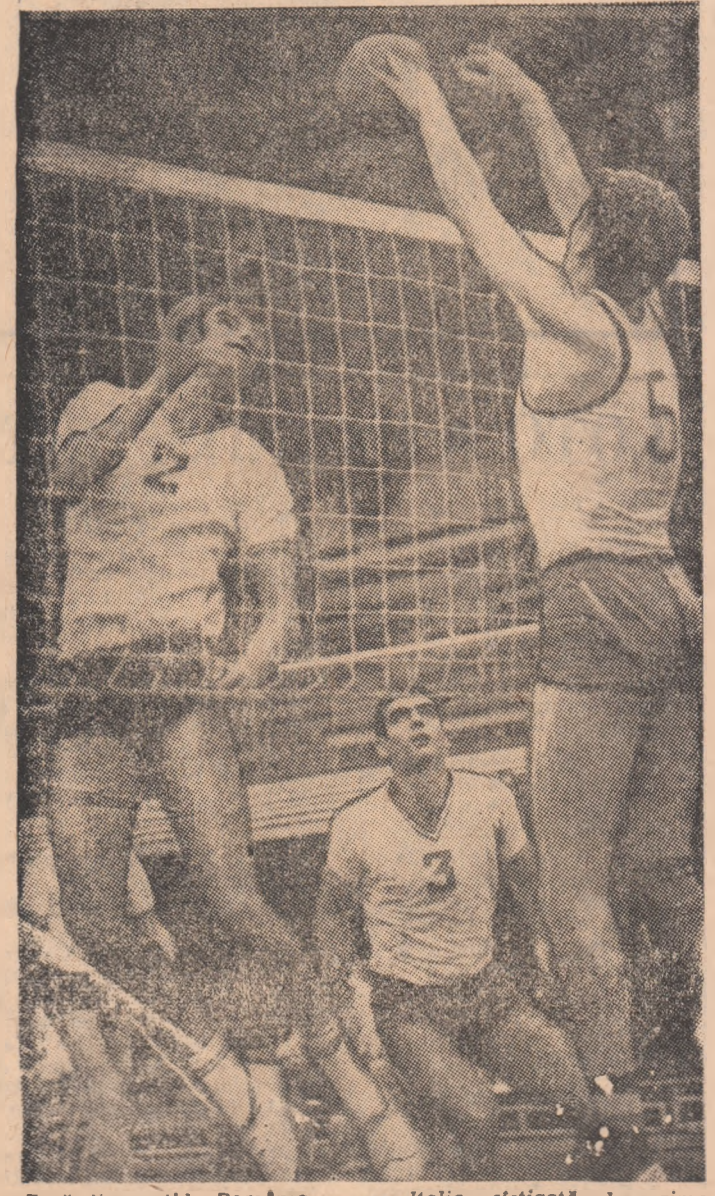
Fază din partida România — Italia, cîștigată de prima formație cu 3-0