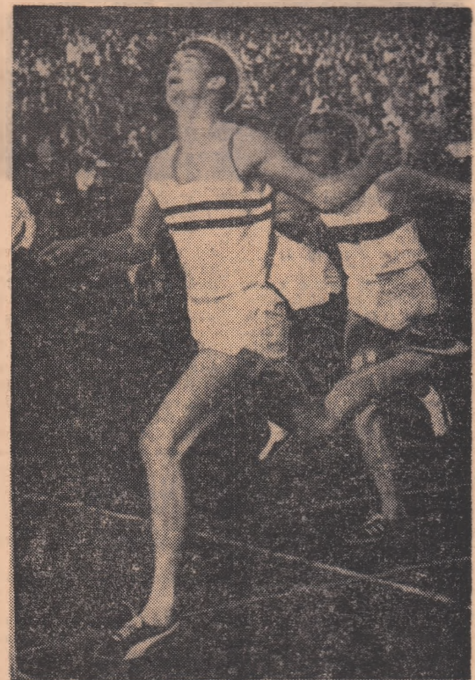
Instantaneu din recenta întîlnire athletică R.F.G. — Anglia, desfășurată la Hamburg; britanicul David Jenkins (cronometrist în 47,2) întrece pe vest-germanul Ingo Roper în finalul cursei de 400 m plat.

În cadrul unui concurs internațional athletic, care a avut loc în localitatea Maria Enzersdorf (Austria), sportiva elvețiancă Sieglinde Amann a terminat învingătoare în proba de săritură în lungime cu o performanță remarcabilă: 6,64 m. Pe locul secund s-a clasat austriaca Liesel Prokop (campionă europeană la pentathlon) cu o săritură de 6,48 m, rezultat ce reprezintă un nou record al Austriei.