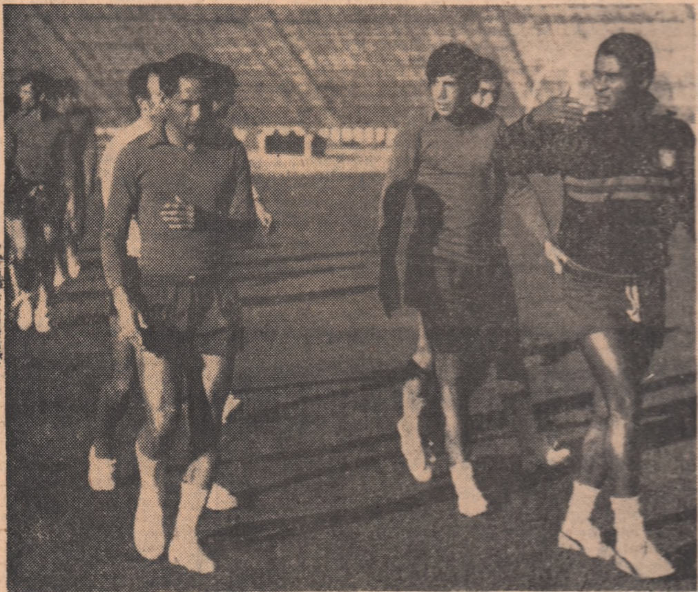
Secvență din antrenamentul de ieri al portughezilor