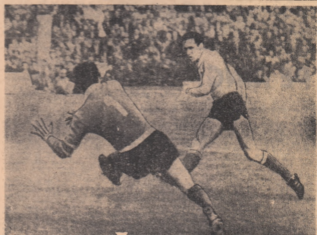
Minutul 14 — portarul portughez, Damas, a înghesat lansat ideal de Dobrin, Dembrovski a pătruns în careu, dar a trimis balonul peste bară. Ocazie mare ratată.