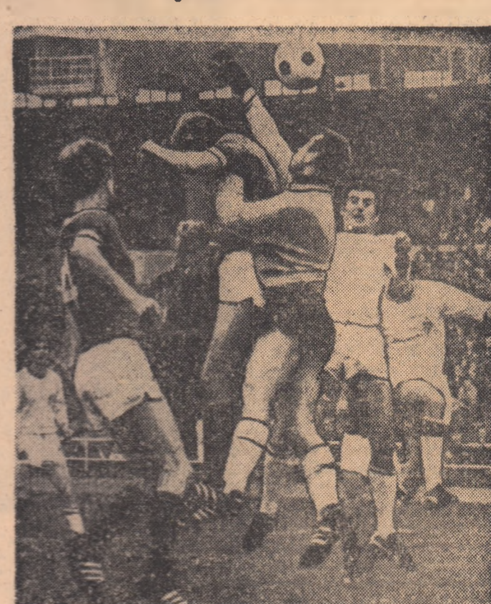
Aglomerare în careul lui Werder Bremen, în meciul din campionatul vest-german, cu Borussia Moenchengladbach (tri-culoare albe). Jocul, desfășurat la Bremen, s-a încheiat egal: 1-1.

Fără îndoială că meciul cel mai important din această săptămînă fotbalistică este cel de la Salonic, unde se întîlnesc reprezentativele Greciei și Elveției. Din punctul nostru de vedere, acest joc prezintă un interes major, deoarece de rezultatul de miercuri sînt legate următoarele calcule pentru configurația finală a clasamentului grupei I. Echipa învinsă în acest meci nu mai poate avea nici o șansă pentru primul loc! Un scor egal poate menține în cursă ambele formații. În orice caz, după partida de la Salonic vom ști mai exact de cite puncte are nevoie echipa României, în ultimul joc, pentru a se califica în turneul final din Mexic. La Stockholm, echipa Francezilor susține un meci decisiv cu Suedia. O înfringere a francezilor va însemna pierderea oricărei șanse de a mai fi prezenți în turneul din Mexic. Reprezentativa U.R.S.S. are prima șansă în meciul revanșă cu Irlanda de Nord cu care a terminat la egalitate în partida susținută în deplasare. După această întîlnire formația sovietică mai are de susținut cele două meciuri cu Turcia. În fine, programul săptămînii mai cuprinde două jocuri, care deși figurează în preliminariile C.M., pot fi numite „amicale” pentru că ele nu mai pot influența poziția primei clasate: Belgia. Este vorba de meciurile Fin-