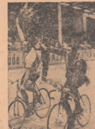
Și totuși probele de velodrom, continuă să atragă multitudine...

Pe acest fundal însă, al curselor-gigant (ca traseu, durată, firmă comercială, echipe